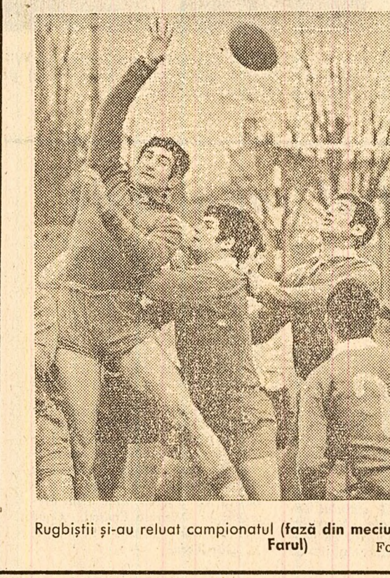
Rugbiștii și-au reluat campionatul (fază din meciul de ieri Steava-Farul)

● NOI REZULTATE DE VALOARE LA PRIMELE CAMPIONATE EUROPENE DE ATLETISM ÎN SALĂ (corespondență specială de la Viena). ● FOOTBALL. ETAPA A XVII-A A CAMPIONATULUI DIVIZIEI A: COMENTARIU, REZULTATE, CLASAMENT. ● ACTUALITATEA ÎN SPORTURILE DE IARNĂ. ● BRAZILIA — ARGENTINA, UN MECI CARE A ELECTRIZAT CONTINENTUL SUD-AMERICAN (corespondență specială din Rio de Janeiro). ● ALTE ȘTIRI DIN ȚARA ȘI DE PESTE HOTARE.