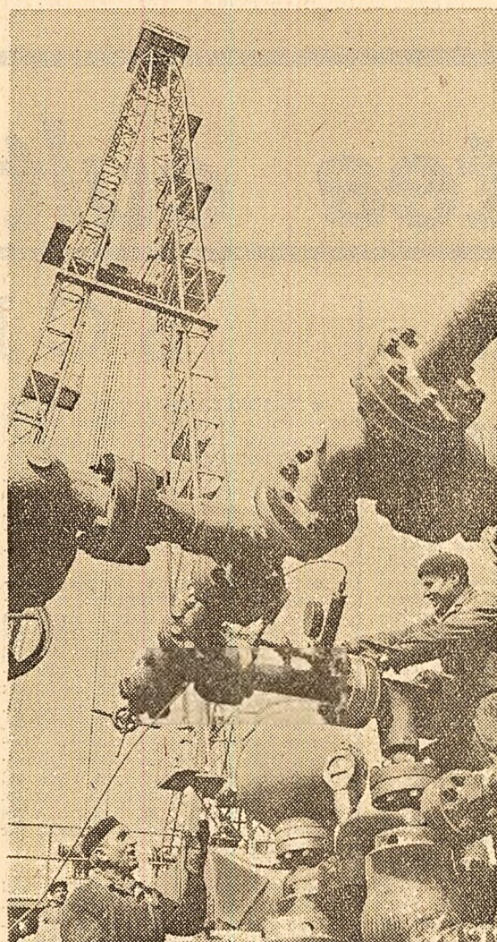
Instalația de foraj F 200-2 D.H. pe platforma de montaj general a Uzinei de utilaj petrolier „1 Mai” Ploiești.

ÎN PAGINA A II-A ● ACTUALITATEA CULTURALĂ ● ADRESANTUL E CUNOSCUȚ, DAR CRITICILE RĂMÎN LA „POST-RES-TANT” ● PE ROTI, DAR NU PEA MIȘCĂ