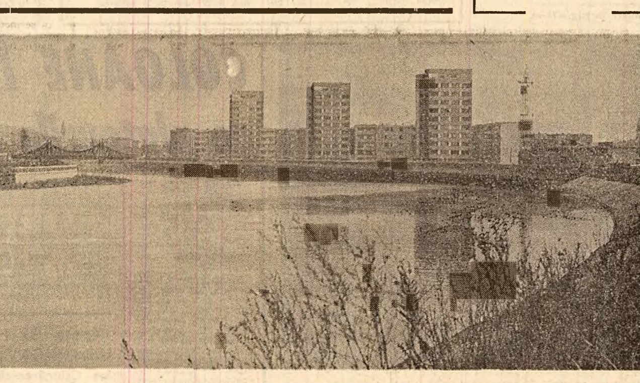
Un grup de locuitori ai comunei Gîlna sectorul V, București