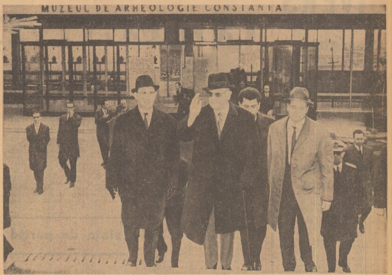
La Muzeul de arheologie din Constanța.