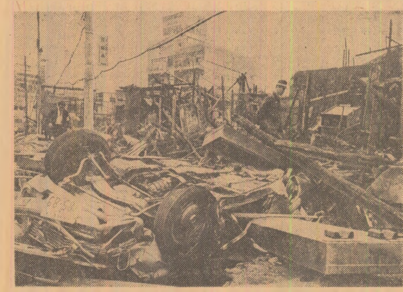
Ravagiul pricinuit de explozia unei conducte de gaz la Osaka (Japonia). Potrivit unui bilanț definitiv 73 de persoane au fost omorâte, iar 281 rănite. Pagubele materiale sînt considerabile

Ciocnirile armate în Cambodia se desfașoară la numai 30 de km de orașul Pnom Penh, capitala țării. Agențiile de presă menționează, totodată, că întreaga regiune Saang (situată în apropierea Pnom Penhului) se află sub controlul forțelor de rezistență populară cambodgienă și că acestea continuă să-și consolideze pozițiile în zona respectivă.