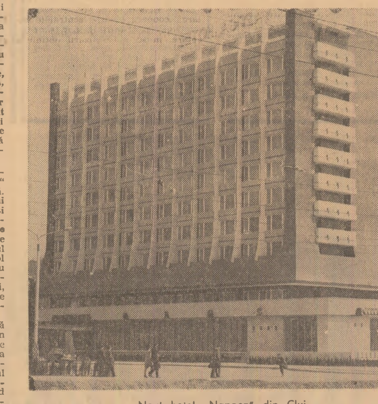
Noul hotel „Napoca” din Cluj

indiguită nu pot fi cultivate imediat. Ceea ce se cere organelor agricole este să stabilească de la bun început destinația acestora pentru a fi puse în valoare în modul cel mai economic, aplicîndu-se lucrări corespunzătoare, fără cheltuieli inutile. Se poate afirma că, în multe cazuri, tergiversarea unor hotărîri care trebuiau luate mult timp a dăunat și pisciculturii. Specialiștii Ministerului Indus-