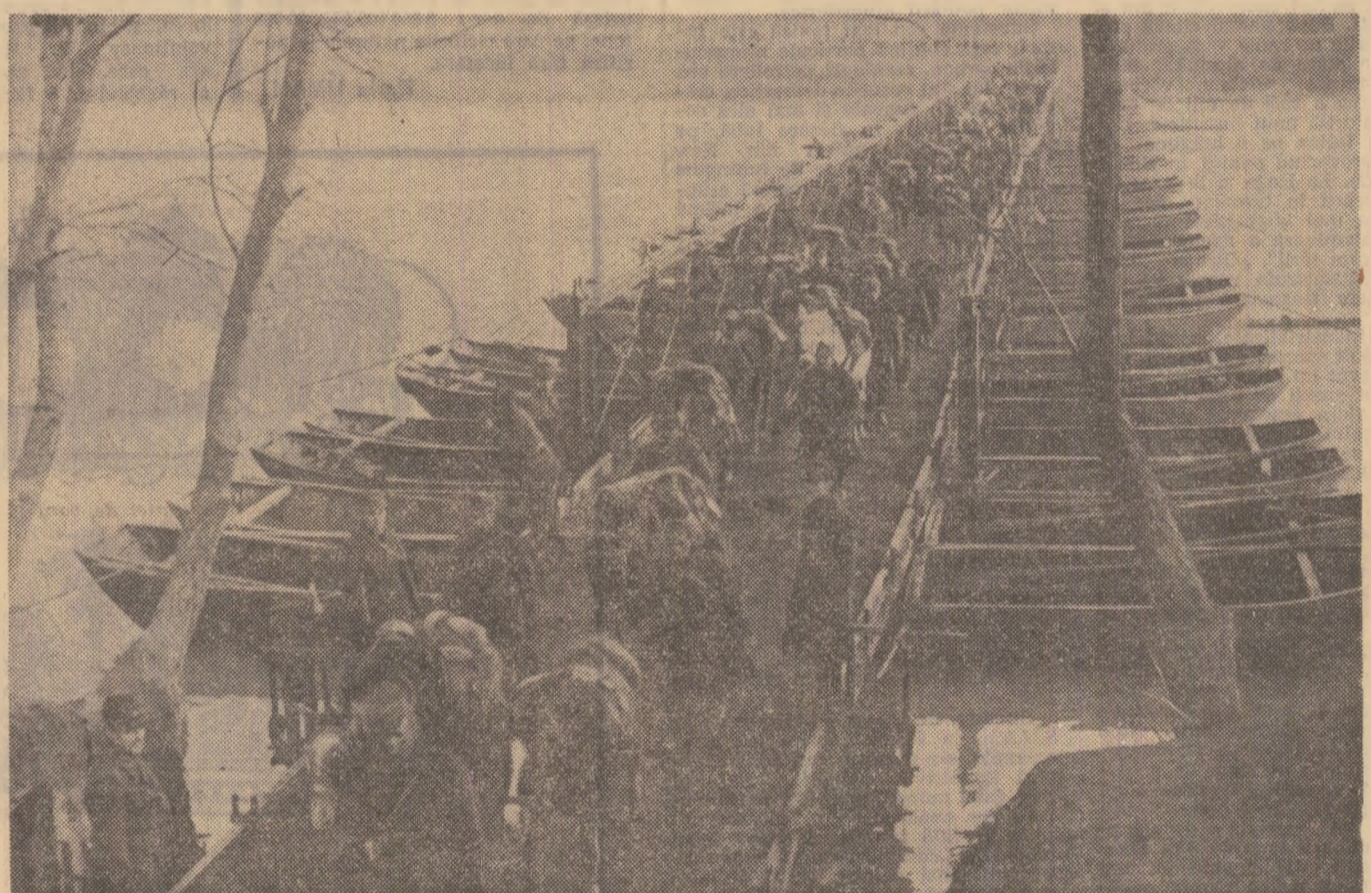
Unul din punctele de trecere peste Tisa a armatelor românești: Tiszalök. Pod făcut de pontonierii noștri