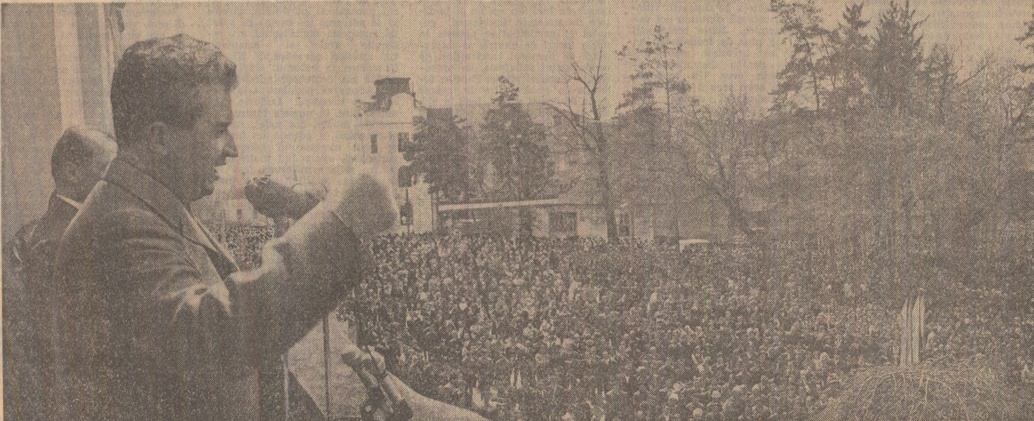
Adunarea populară a locuitorilor din Miercurea Ciuc — o viguroasă afirmare a tradiției unității tuturor oamenilor muncii din patria noastră, indiferent de naționalitate, în jurul partidului, al conducerii sale

COMITETUL CENTRAL AL PARTIDULUI MUNCII DIN ALBANIA PREZIDIUL ADUNĂRII POPULARE A REPUBLICII POPULARE ALBANIA CONSILIUL GENERAL AL FRONȚULUI DEMOCRATIC DIN ALBANIA