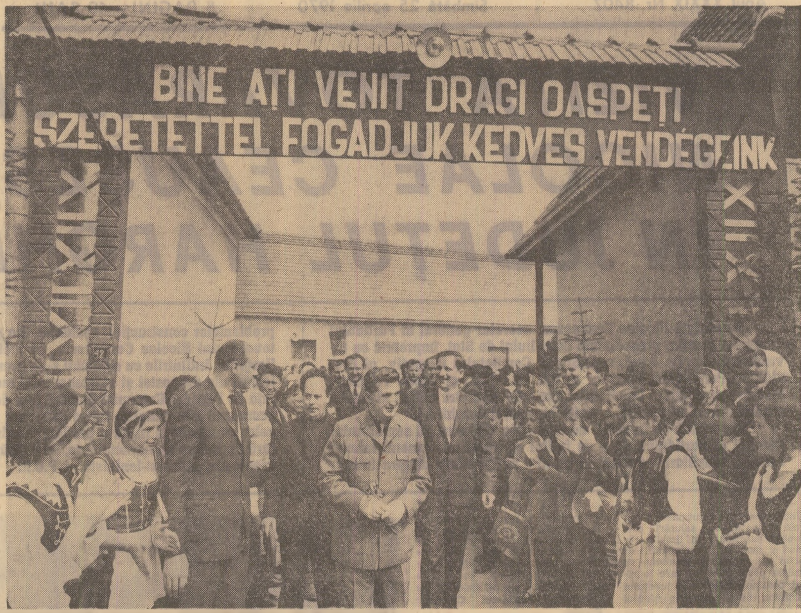
În mijlocul operatorilor de la C.A.P. Tușnad-sat

Întîmpinat cu aplauze și urale de către mulțimea ce se află în fața sediului cooperativei, a luat cuvîntul tovarășul NICOLAE CEAUȘESCU.