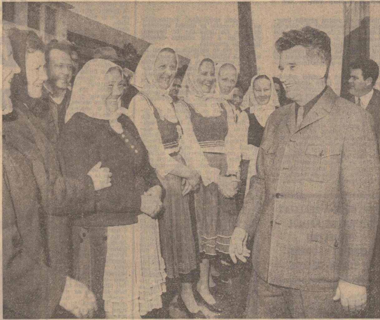
Preţutindeni, conducătorul partidului şi statului este împinţat cu dragoste şi căldură

Adunarea populară a locuitorilor din Miercurea Ciuc a constituit o viguroasă afirmare a trîniciei unităţii tuturor oamenilor muncii din patria noastră, indiferent de naţionalitate, în jurul partidului, al conducerii sale, a hotărîrilor lor de a fi trup şi suflet uniţi în muncă pentru patria noastră — Republica Socialistă România — pentru partid, pentru Comitetul său Central.