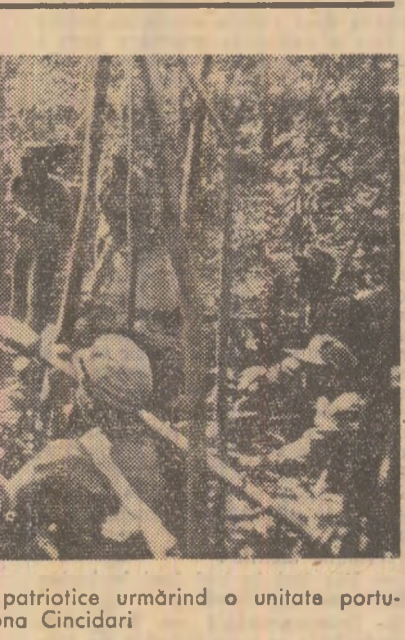
Guinea-Bissau. Luptători ai forțelor patriotice urmînd o unitate portugheză în zona Cincidari

didatilor partidelor republican și democrat pentru alegerile propriu-zise, care urmează să se desfășoare în luna noiembrie. Atenția observatorilor este îndreptată în special asupra alegerilor din statul Alabama, unde fostul guvernator George Wallace, cunoscut pentru vederile sale rasiste, apreciază câștigarea acestor alegeri drept un act important în intențiile sale de a-și prezenta din nou candidatura la președinția S.U.A.