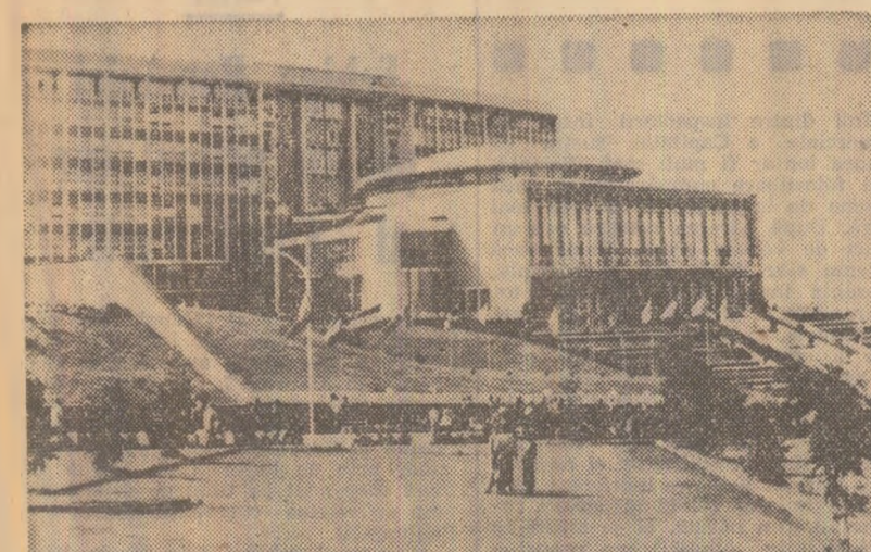
Vedere din Addis Abeba

Poporul etiopian sărbătorește astăzi a 29-a aniversare a eliberării țării sale de sub ocupația fasciștilor italieni. Târziu a unei străvechi civilizată, Etiopia este unul dintre cele mai vechi state independente de pe continentul african, cu un popor dârz și curajos, care s-a ridicat nu o dată la luptă pentru a-și apăra patria. În 1935, când Etiopia a fost victima agresiunii fasciste, etiopienii au înscris adevărate pagini de eroism prin rezistența hotărâtă pe care au opus-o invadatorilor. Poporul român a urmat cu admirație lupta etiopienilor pentru apărarea independenței naționale, exprimându-și solidaritatea cu acesta și condamnămnd pe agresor.