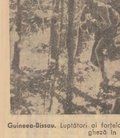
Guinea-Bissau. Luptători ai forțelor patriotice urmînd o unitate portugheză în zona Cincidari

În statele americane Alabama, Ohio și Indiana au loc marși alegeri preliminare pentru funcțiile de guvernatori și membri ai Congresului. Scrutinul are drept scop desemnarea can-