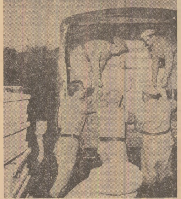
Țara întreagă are grijă de acest copil

Nu vom uita niciodată mîna întinsă de frații noștri din toată țara — ne spune el. Nu se simțim singuri și părășiți — asta e lucrul cel mai important, căci primim nu numai lucruri, ci și încredere în puterea noastră unită.