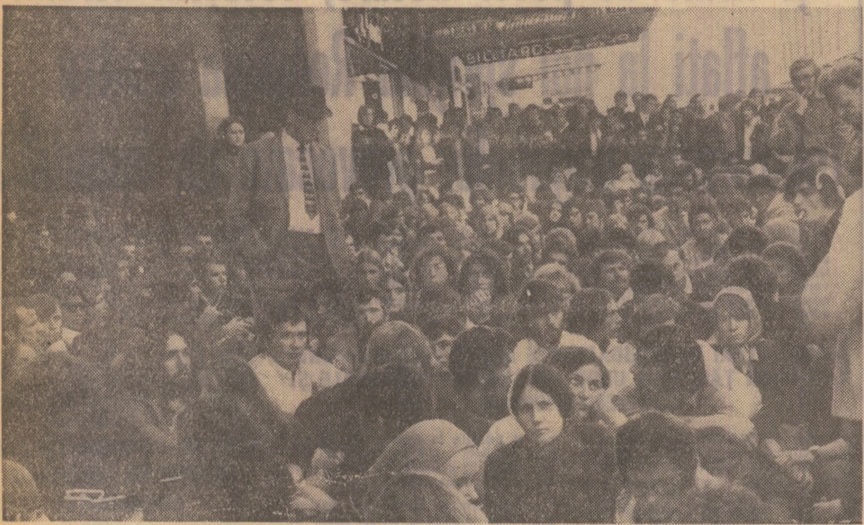
Imaginea de mai sus redă un aspect de la o manifestație a tineretului din orașul Auckland (Noua Zeelandă) în semn de protest împotriva participării, alături de armatele S.U.A., a unor unități neo-zeelandeze la războiul din Vietnam.