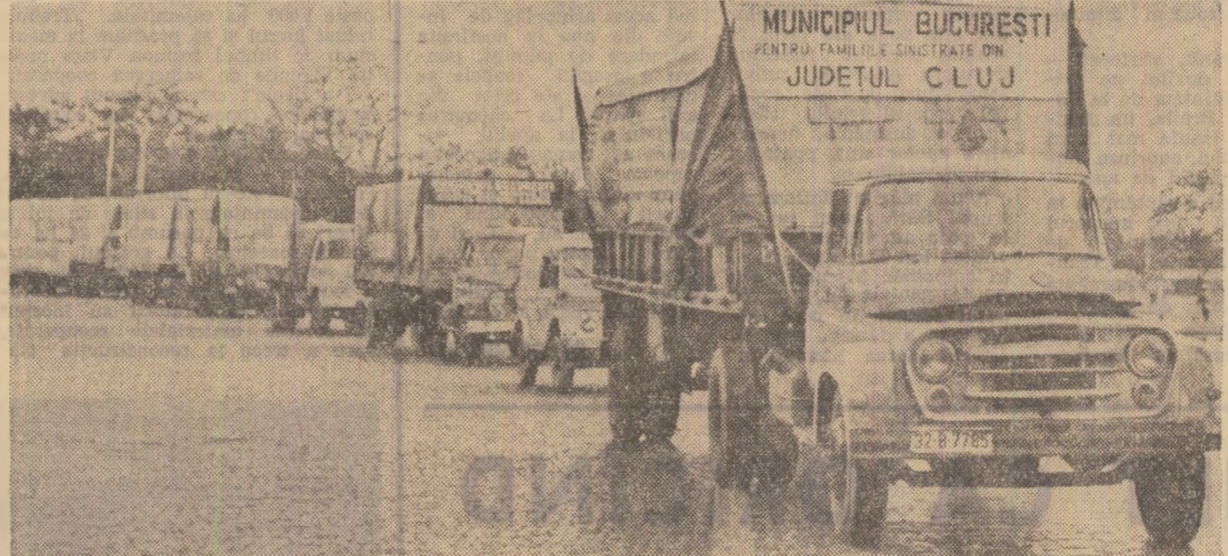
Un nou eşalon — la drum

În diferite localități din zonele sinistrate au început să sosească primele cantități de obiecte, medicamente, alimente provenite din donațiile guvernului străin, societăților de Cruce Roșie din diferite țări, precum și ale organizațiilor și persoanelor particulare de peste hotare.