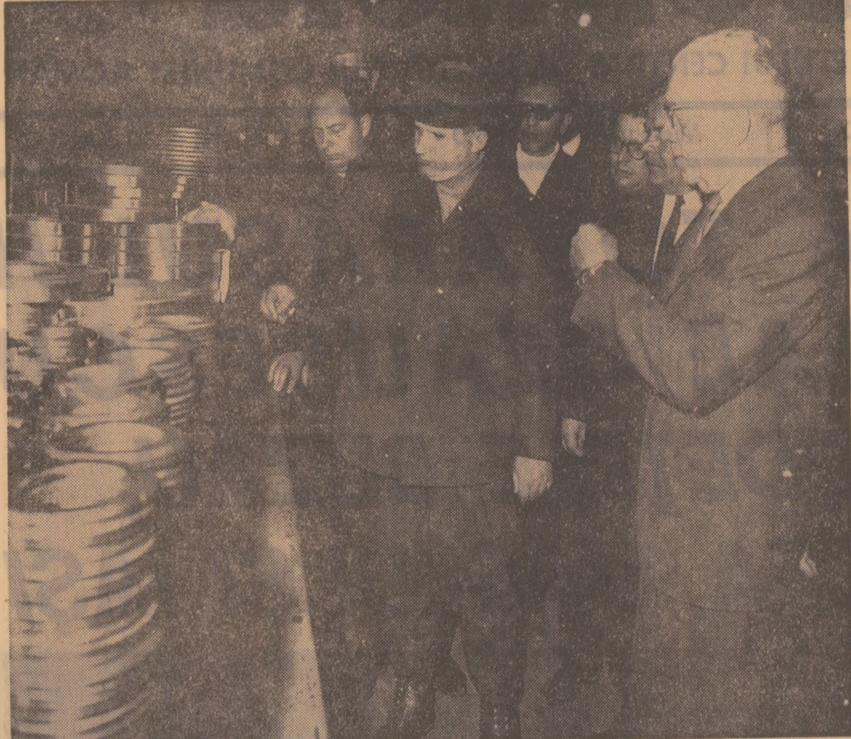
La fabrica „Rulmentul”-Birlad

În jurul orii 18,00 elicopterul în care se află tovarășul Nicolae Ceaușescu aterizează pe aerodromul situat pe una din colinele Iasului. Aici vin în întîmpinare Miș Dobrescu, prim-secretar al comi-