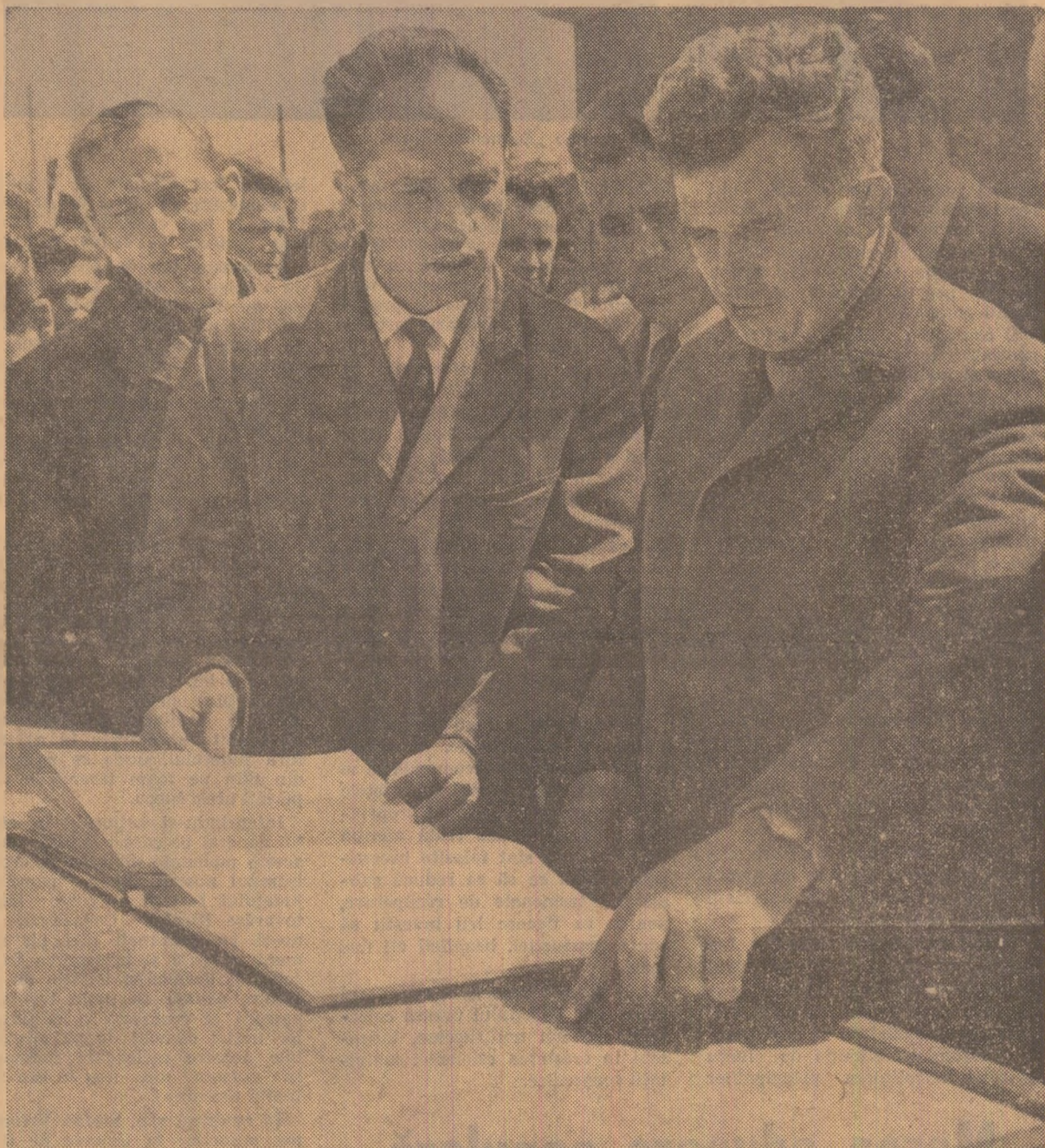
Tovarășul Nicolae Ceaușescu dă indicații asupra dezvoltării în perspectivă a Combinatului de exploatare și industrializare a lemnului din Focșani

Alături această vizită cît și celelalte întâlniri cu populația din zonele sinistrate dovedesc înaltă răspundere și grijă statornică a secretarului general al partidului față de destinele națiunii, față de prezentul și viitorul poporului. Am fost martori la manifestări de neșărmătată iubire, de mare bucurie umană, începînd de la gestul spontan al pionierilor vasluieni, care i-a oferit cravata sa tovarășului Ceaușescu, și pînă la zecile și zecile de mii de țeseri care, în Piața palatului, au scandat minute în șir „Ceaușescu-Ceaușescu”, „Ceaușescu și poporul”, „P.C.R.-Ceaușescu”. Tăra în haine de lucru, cu miștile pe unelte, lucid, bărbătește, îi asigură pe conducătorul ei că nici o piedică nu este prea mare, că nu există obstacol de netrecut atunci cînd întreaga suflare românească este animată de un singur gînd, de o singură voință.