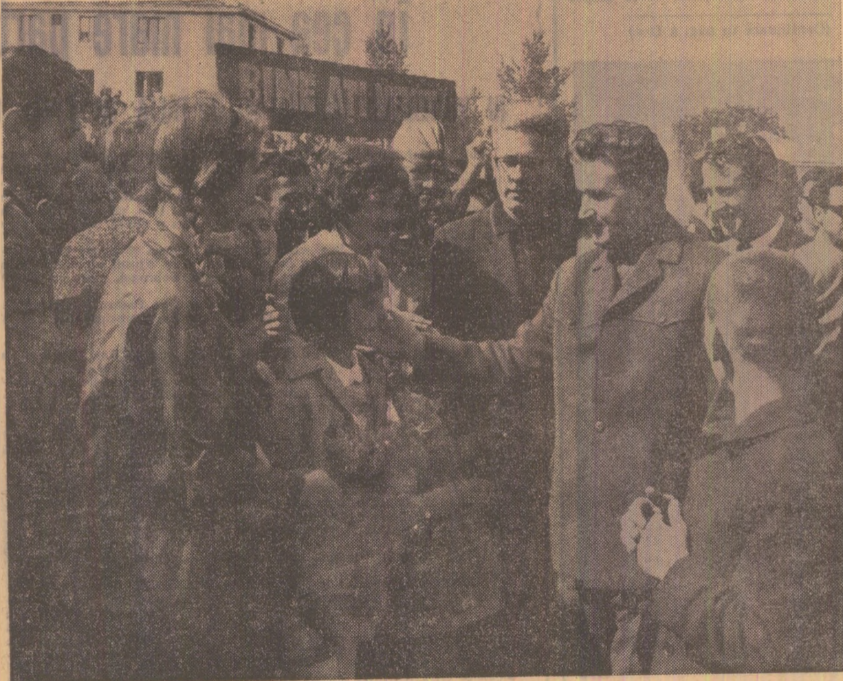
Prețutindeni — surisul cald al copiilor