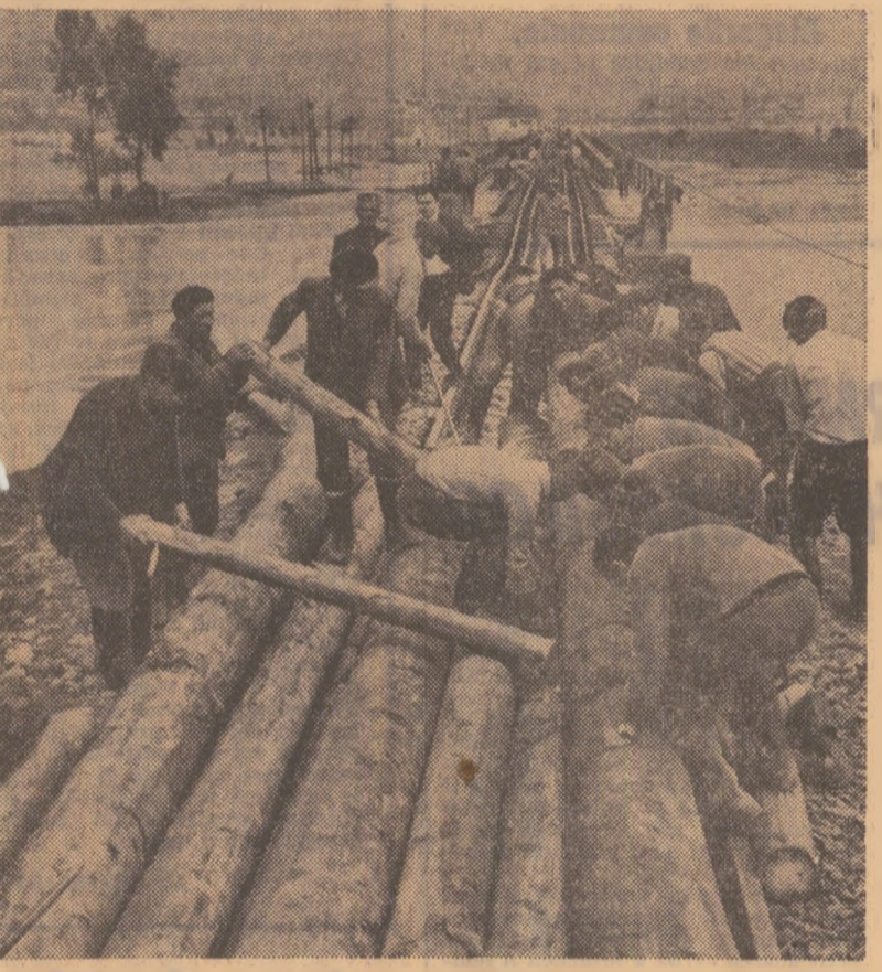
Abia de cîteva ceasuri s-au retras apere. Oamenii ou ieșit la lucru să refacă podul de cale ferată peste Someș

CONTUL 2000 Intr-o zi — de la 14 la 20 de milioane Pînă la data de 26 mai, orele 12, depunerile au crescut de la 14 234 000 lei, la un total de 20 855 000 lei.