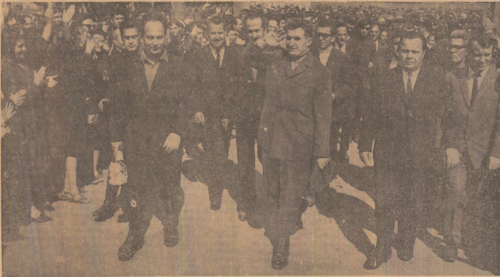
Locuitorii Birladului fac o călduroasă primire conducătorilor de partid și de stat