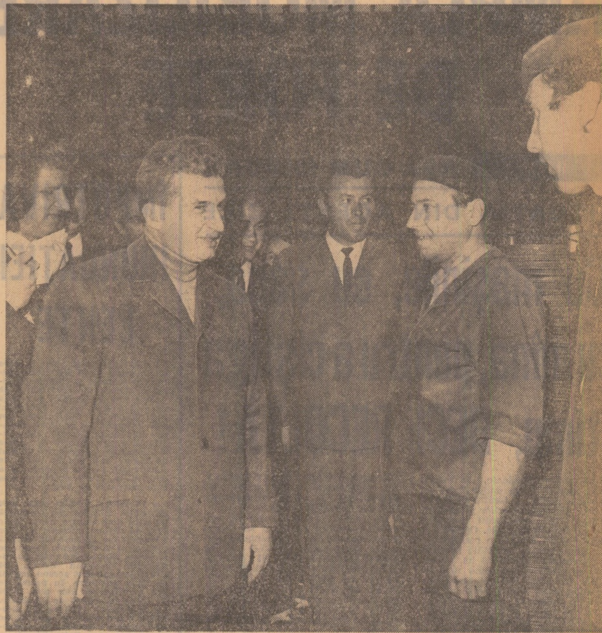
În mijlocul muncitorilor de la Uzina de sîrmă din Buzău

Dați-mi voie, tovarăși, ca, în încheiere, să vă urez din toată inima multe succese în activitatea dumneavoastră, activitate care, în anul acesta, va trebui să fie și mai intensă, să se desfășoare cu și mai multă forță. Vă doresc să realizați în cele mai bune condiții tot ceea ce v-ați propus! Tutaror — multă sănătate și ferice! (Aplauze puternice, prelungite; minute în șir — ovăși și urale; se scandează „Ceaulescu — Ceaulescu” — „P.C.R. — P.C.R.”).