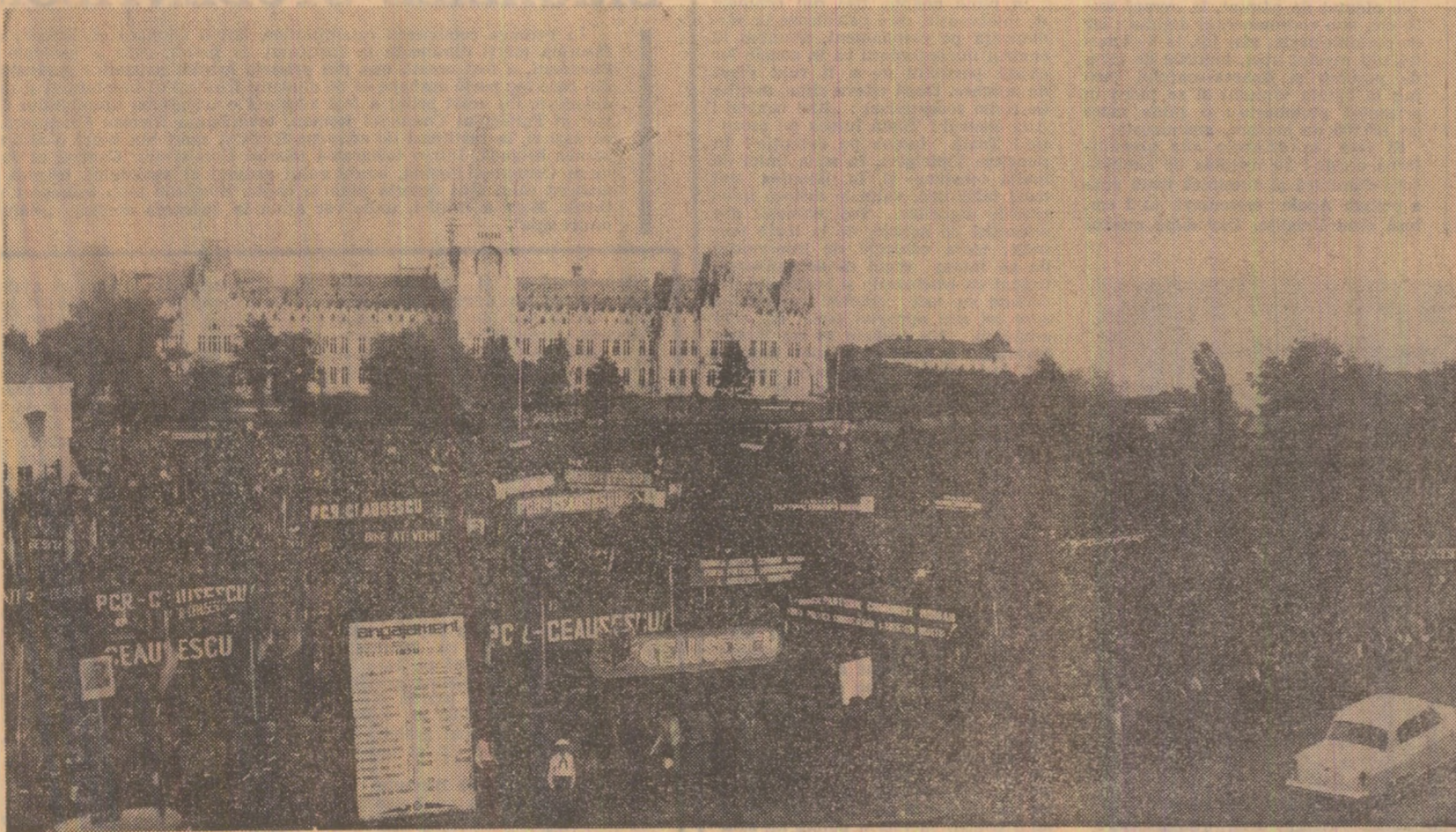
În timpul adunării populare din Iași