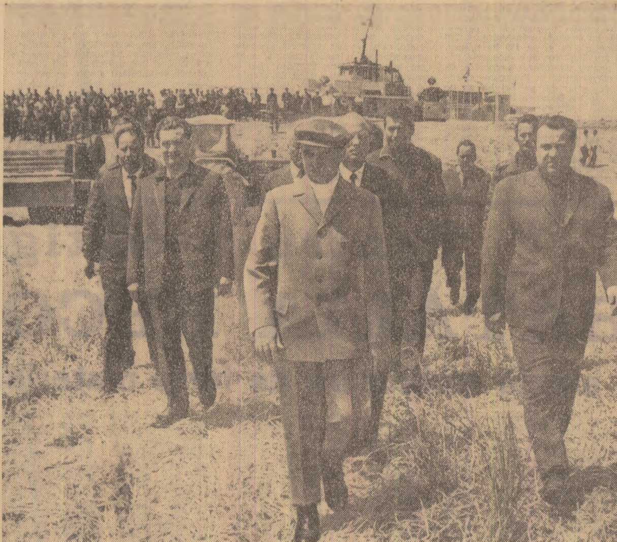
În zona digului de la Vlădeni

Primit cu îndelungi aplauze, cu urale puternice a luat cuvîntul tovarășul Nicolae Ceaușescu.