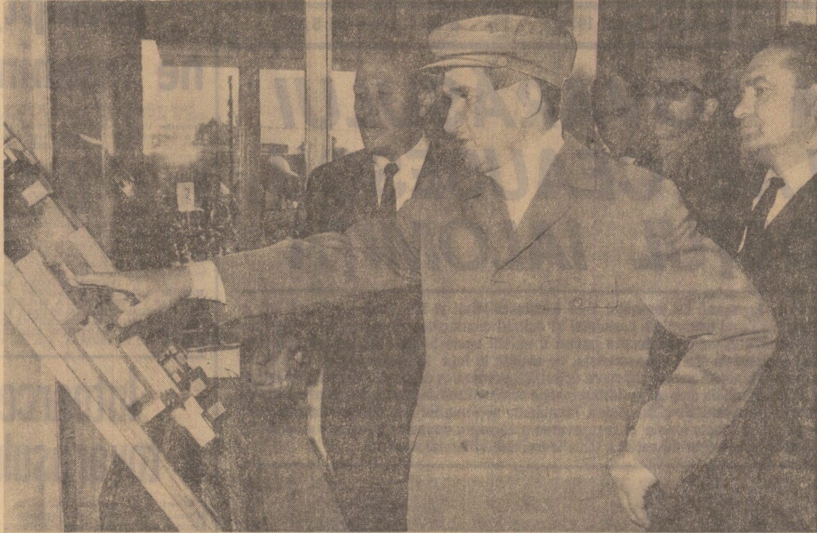
Se înalță un municipiu modern în inima Bărgănelului

După vizitarea sectorului turnătorie, tovarășul Nicolae Ceaușescu, remarcînd deficiențele existente aici, indică luarea nămirii de a unor măsuri energice pentru a se organiza mai bine procesul de producție, a se folosi mai judicios forța de muncă, a se gospodări mai bine utilajele, materia primă, parcul auto.