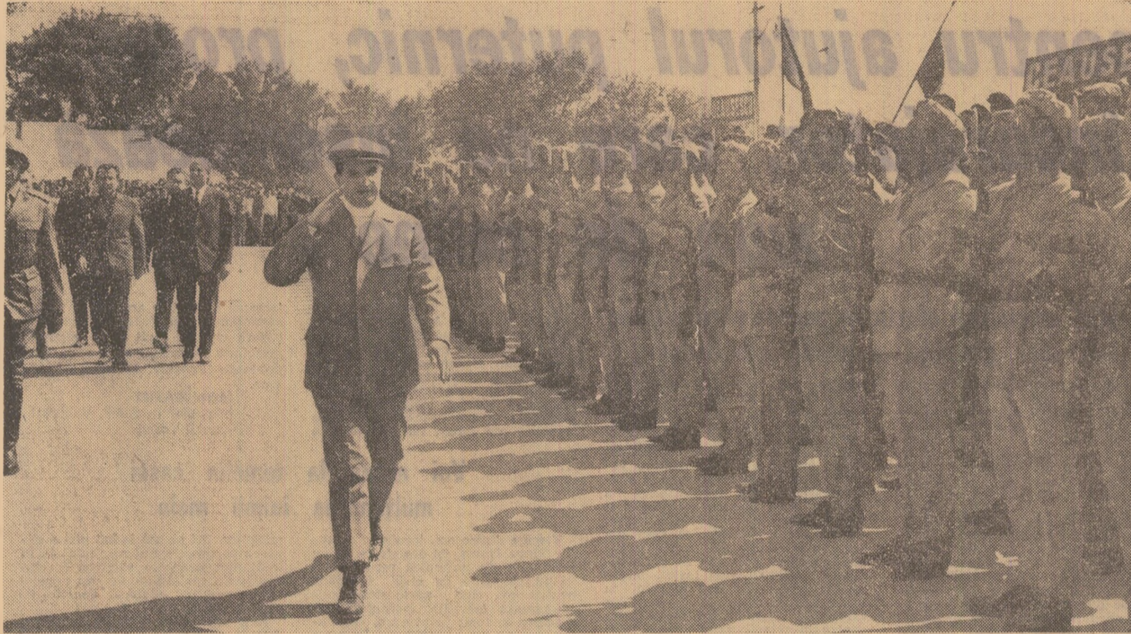
Comandantul suprem al forțelor noastre armate, tovarășul Nicolae Ceaușescu, trece în revistă garda de onoare