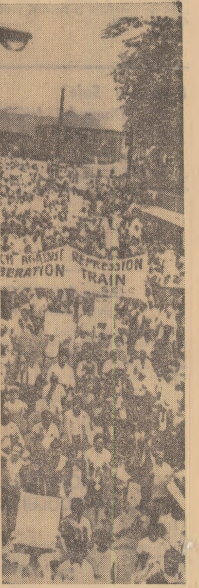
S.U.A. — „Marșul împotriva războiului și a discriminării” organizat la Afonia

Știrile transmise din Bangkok de agențiile americane de presă infor-