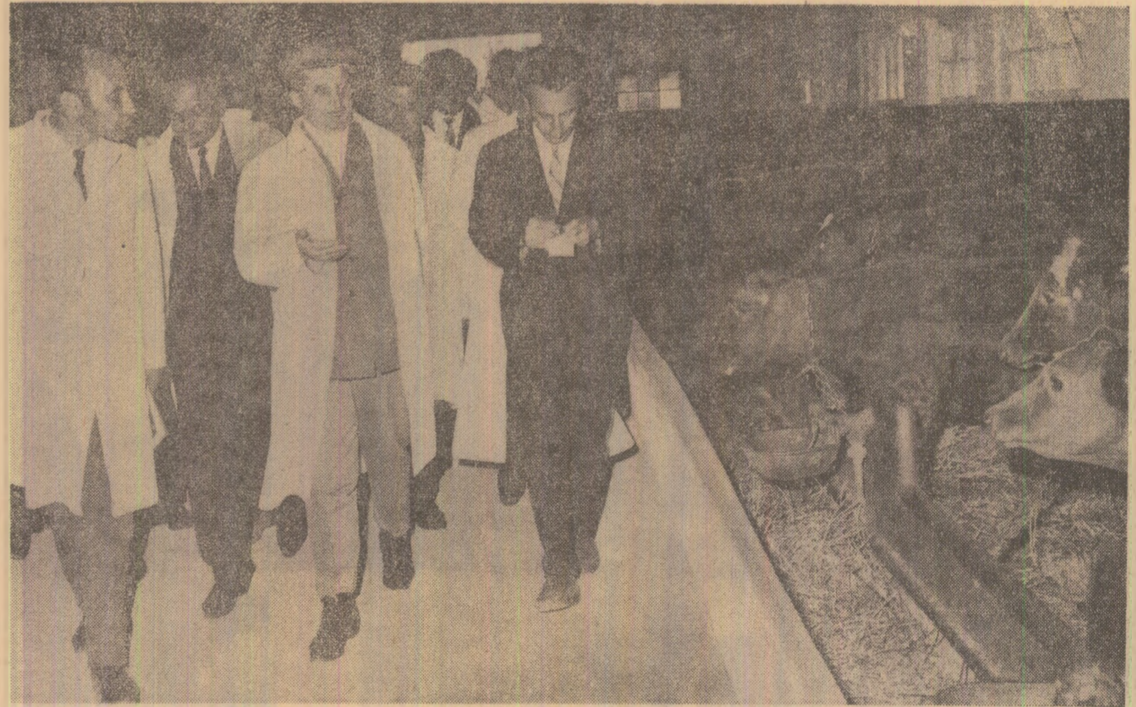
În ferma zootehnică a I.A.S. Ciulința

În unele locuri, pe dig, se lucrează. Vîntul puternic care a stîrnit valuri grele zilele trecute a erodat stăvilărilor înființate de oameni, dar breșele se astupă repede, printr-o muncă fără istov, de zi și noapte, în care sînt concentrate mai for-