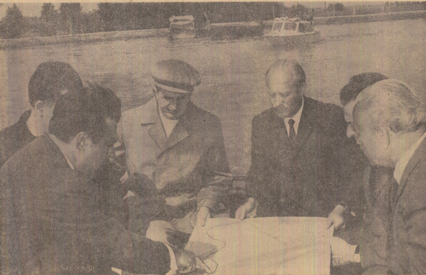
Tovarășul Nicolae Ceaușescu examinează situația îndiguirilor de pe Dunăre