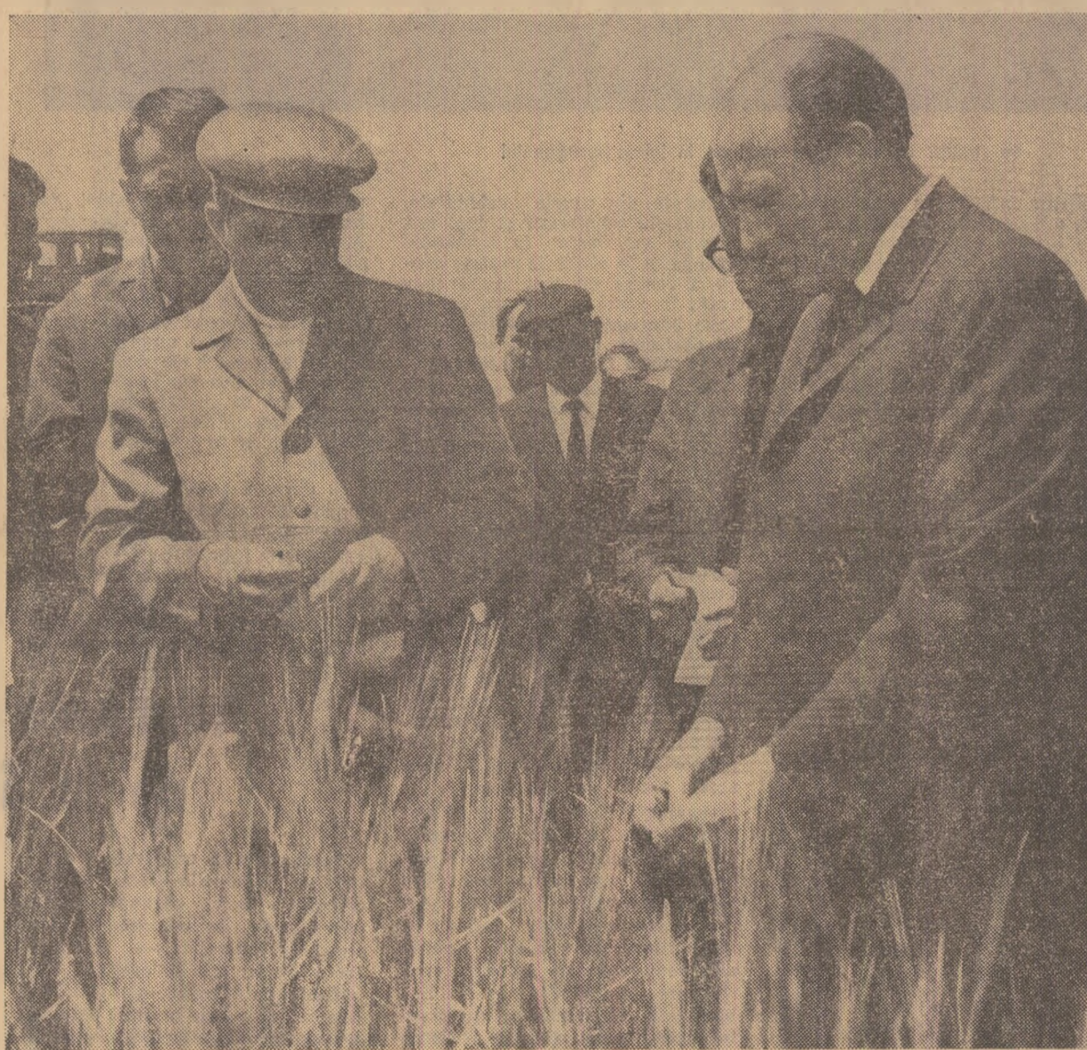
„Va fi o recoltă bună!”

Bărăganul, vatra de pîine a țării, ținut al lanurilor nesfîrșite, ipostază solară a pămîntului românesc,