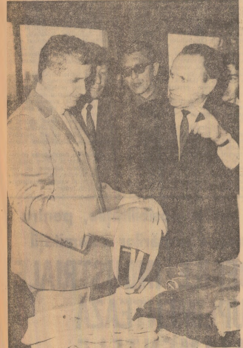
Se examinează calitatea produselor Fabricii de confecții din Călărași

se interesează de măsurile care au fost luate pentru apărarea acestei incinte îndiguite, de situația actuală.