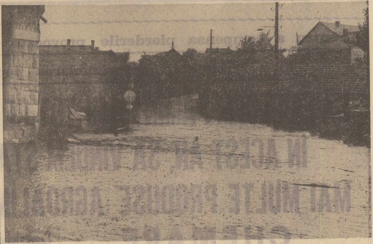
Pînă acum cîteva zile, la acest colț de stradă din cartierul Mănăștur al Clujului se jecau copiii