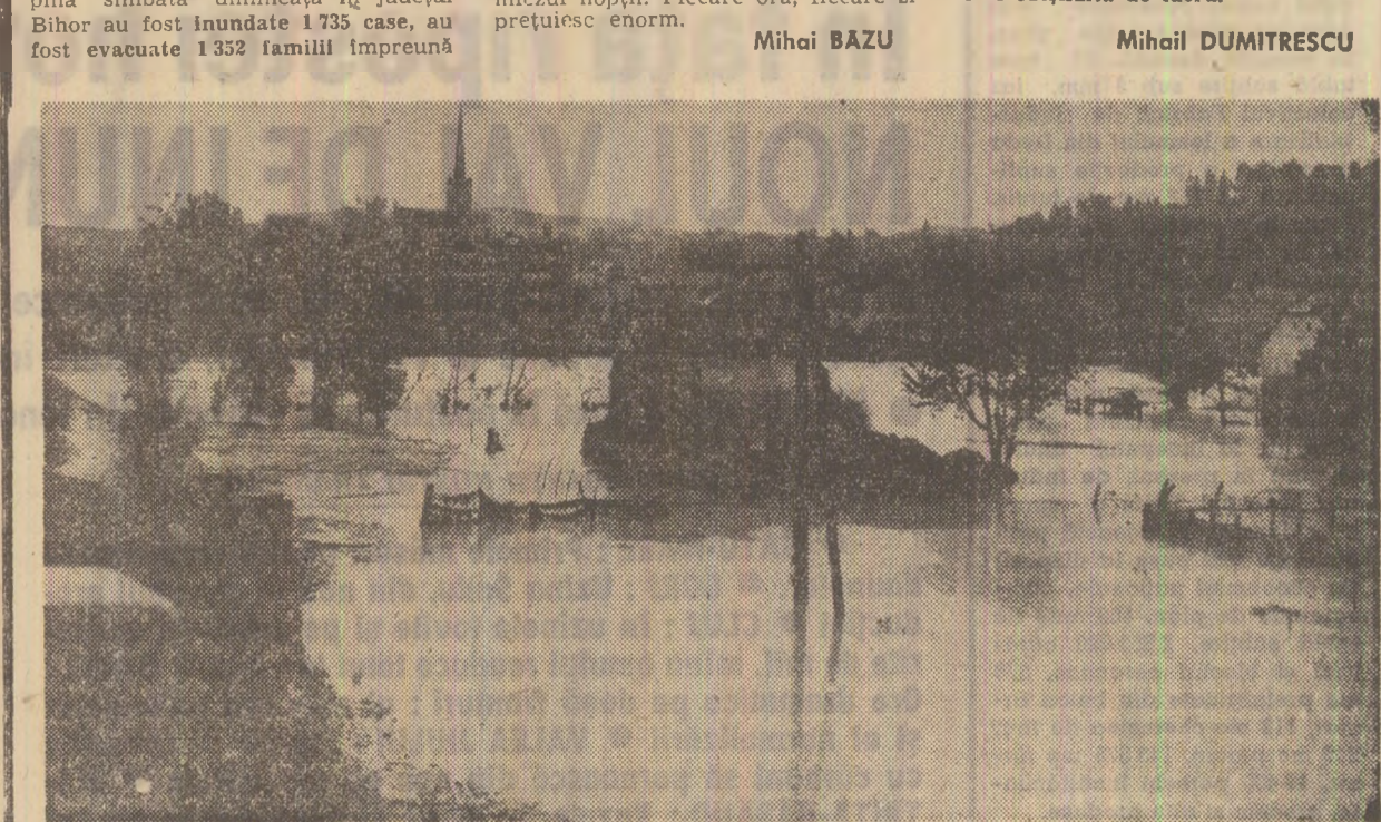
Dej, Noua vitlură solicită din nou efortul de refacere a orașului