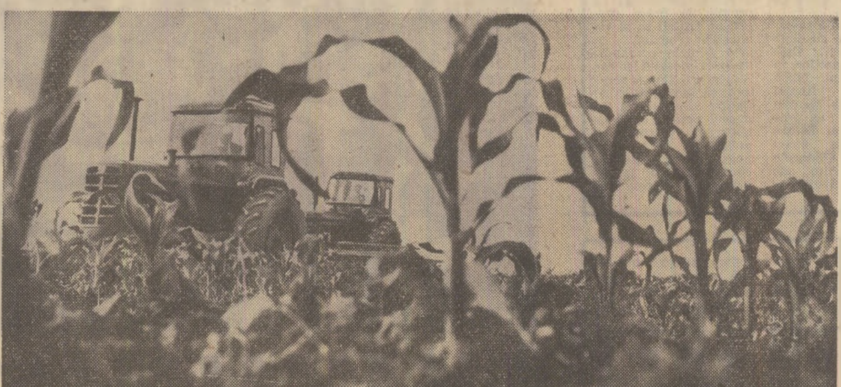
Da, porumbul, ca și alte culturi prășitoare crește vînd cu ochii. Bineînțeles, crește acolo unde se fac la timp și cu răspundere lucrările de întreținere așa cum rezultă și din imaginea de față, surprinsă de cooperativa agricolă din Surăia, județul Vrancea.