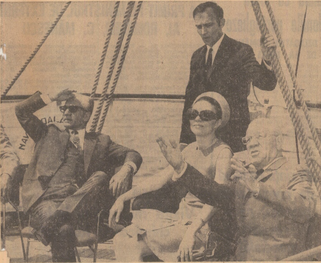
La bordul vasului-școală „Mircea”