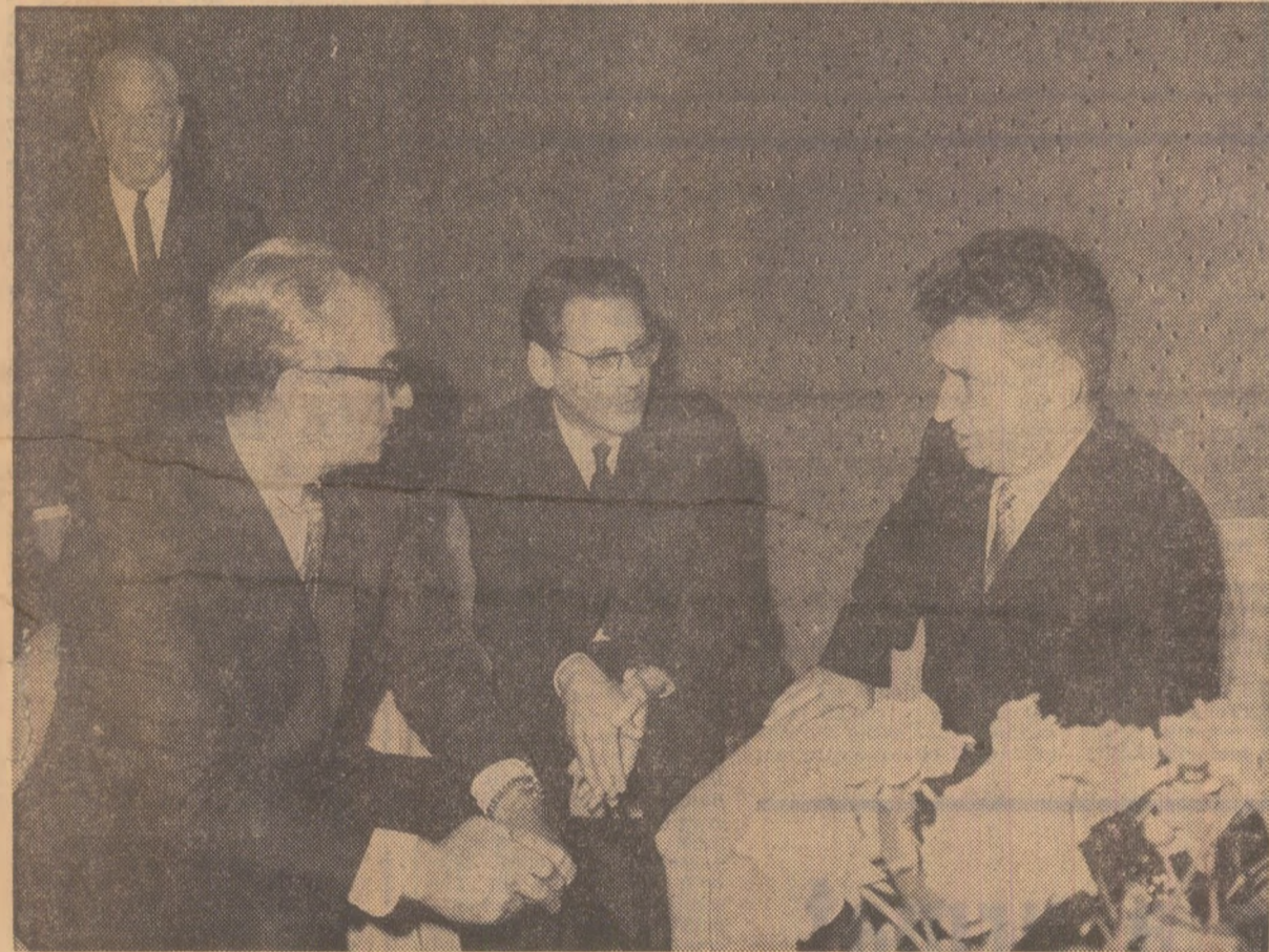
În timpul dineului

evidențiate în cursul acestei vizite și al convorbirilor care au avut loc, președintele Consiliului de Stat, Nicolae Ceaușescu, a toastat în sănătatea Șahinșahului Mohammad Reza Pahlavi Aryamehr și a Impărătesei Farah, pentru dezvoltarea în continuare a relațiilor de prietenie dintre popoarele și țările noastre. Dineul s-a desfășurat într-o atmosferă de cordialitate. (Agerpres)