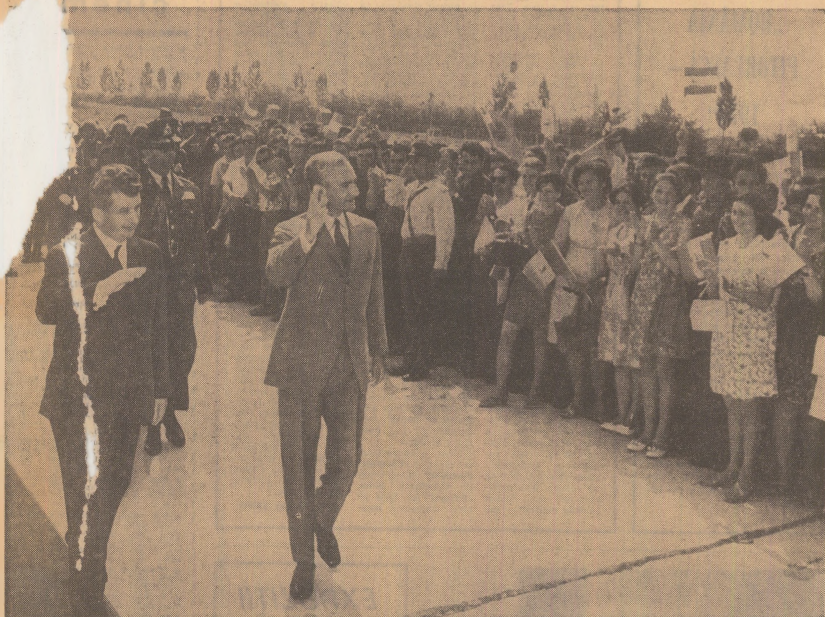
La sosire, pe aeroportul din Craiova