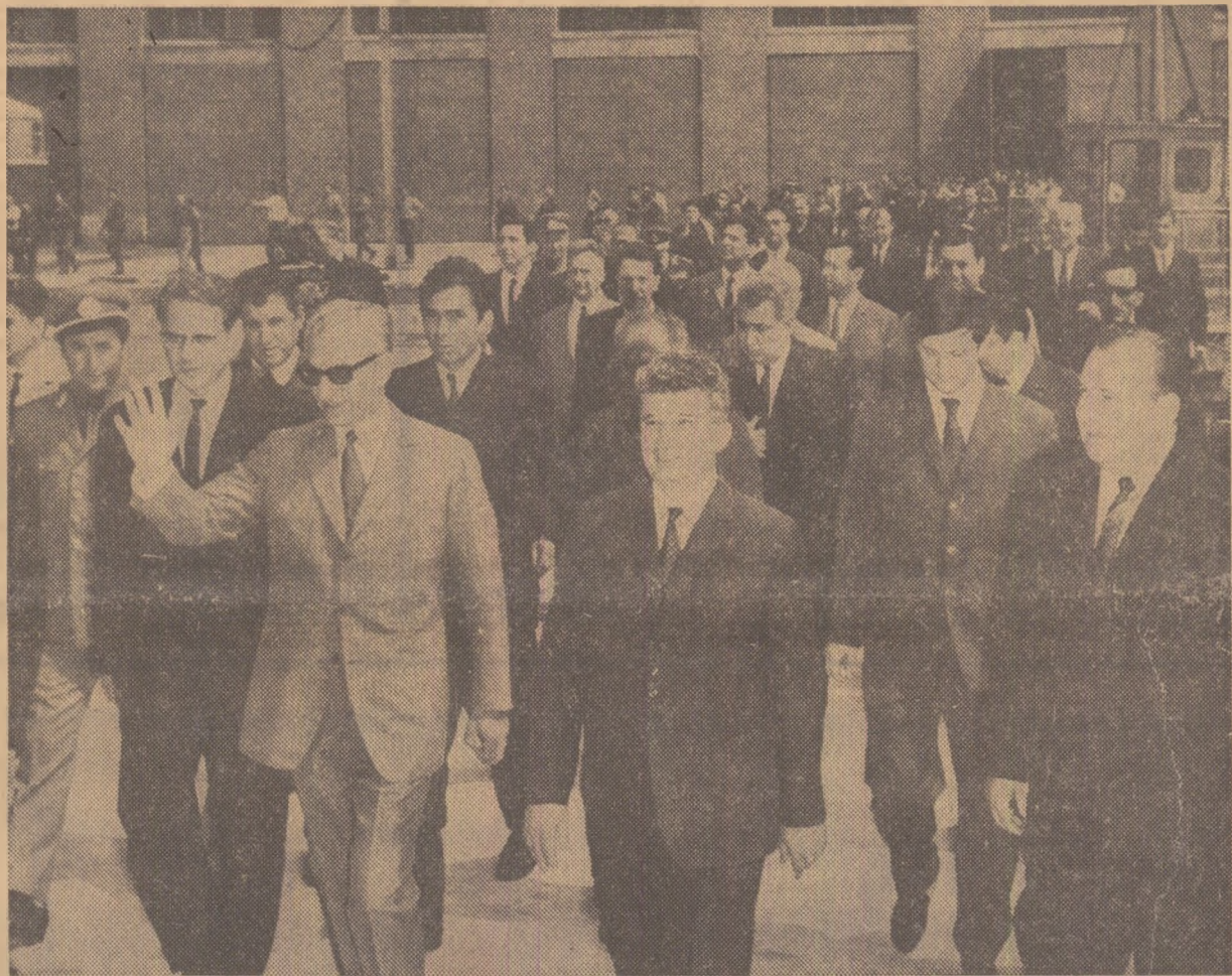
În timpul vizitei la uzina „Electroputere”

Între state cu orinduirii sociale diferite.