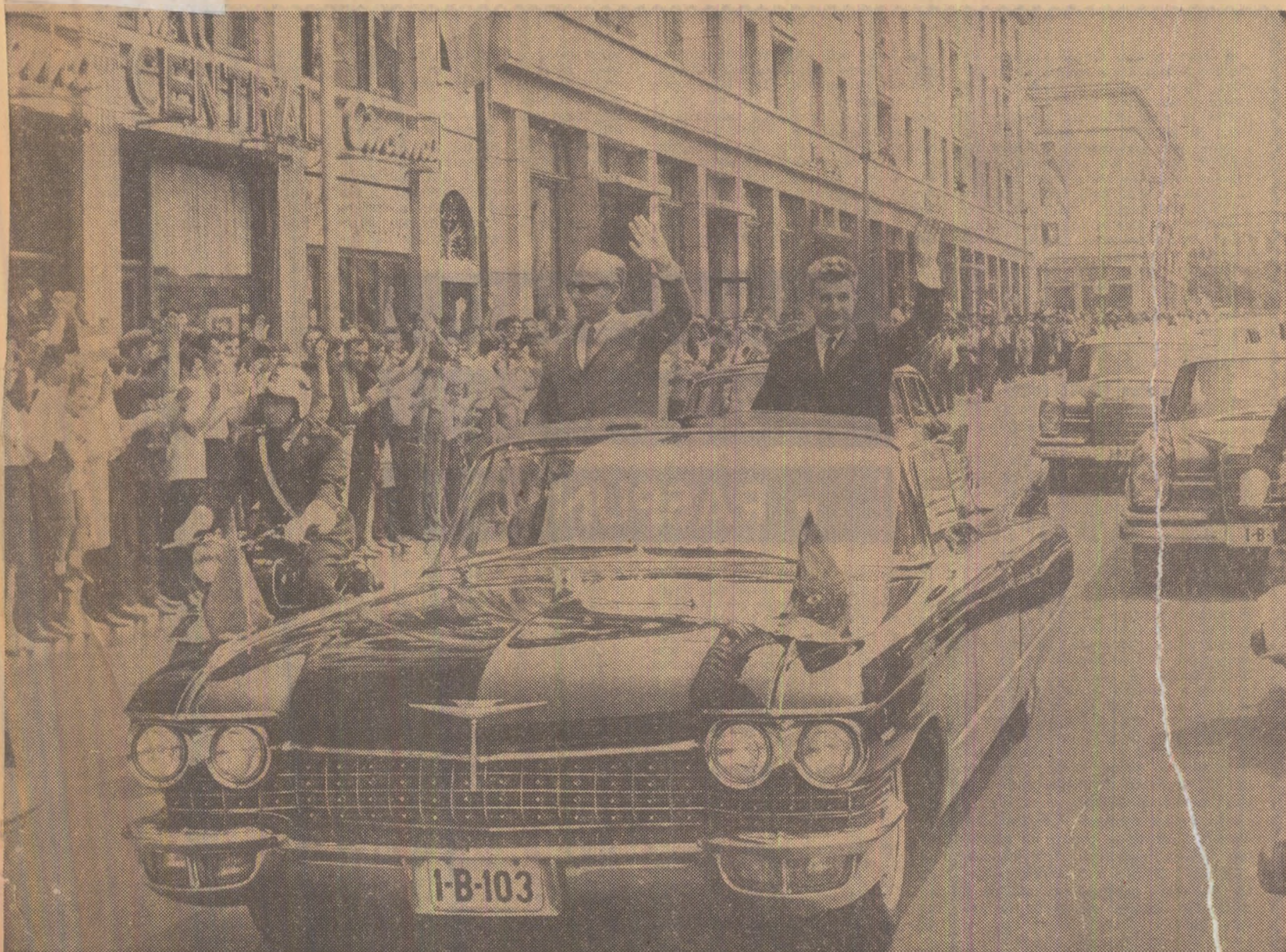
Primo caldurașă pe străzile Craiovei