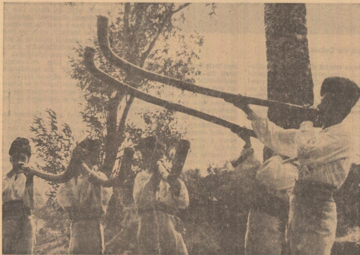
Buciumași din Paltin, județul Vrancea