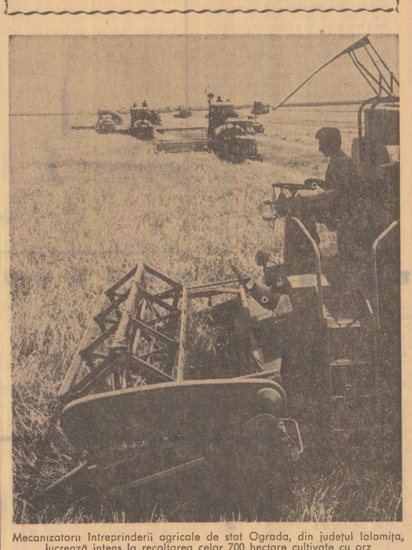
Mecanizatorii întreprinderii agricole de stat Ograda, din județul Ialomița, lucrează intens la recoltarea celor 700 hectare cultivate cu orz.

Constructorii hidrotehniști care lucrează la extinderea portului Constanța au încheiat cu rezultate bune prima jumătate a anului. În această perioadă a fost începută construcția celor două zăhuri de semnalizare la poarta de intrare în noul bazin portuar, și continuată construcția noilor cheiuri și dane, a platformelor, a magazinelor destinate depozitării mărfurilor și a drumurilor de acces. Concomitent, colectivul întreprinderii de construcții hidrotehnice Constanța a terminat și dat în exploatare, înainte de termen, lucrările prevăzute la portul militar de la Mahmudia pentru livrarea carburului necesar marelui combinat siderurgic din Galați, a modernizat 28 km drum-murt, în special pe traseele turistice ale litoralului etc. Planul semestrial al întreprinderii a fost depășit cu 5,11 la sută, realizându-se lucrări suplimentare în valoare de 7 milioane lei.