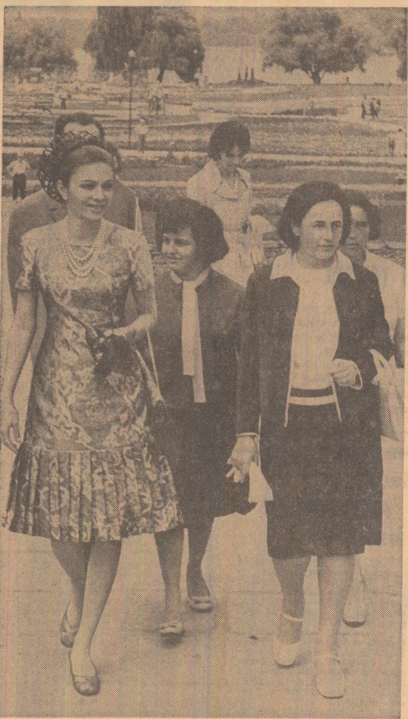
La expoziția de flori din parcul Herăstrău

După un scurt popas la Casa de oaspeți a orașului, convoiul de ma- șini străbate din nou bulevardele Craiovei, înfrumusețate în ultimii ani de o salbă de blocuri construite cu fantezie arhitectonică și bun gust. Distinșilor oaspeți li se a-