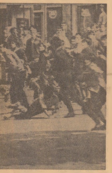
În timpul recentelor ciocniri care au avut loc pe străzile Belfastului (Irlanda de Nord) soldați cu morți și răniți