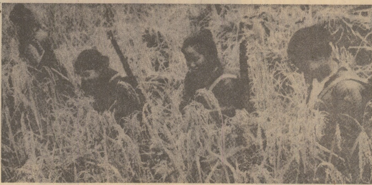
Femei laoziene aparținând forțelor militei populare lucrând pământul într-o regiune eliberată a Laosului. Ele sînt pregătite pentru a se apăra de atacuri inamice prin surprindere

Calea pentru instaurarea păcii în Vietnam de sud, Cambodgia și Laos, se arată în continuare, o condiție încheierea războiului de agresiune dus de S.U.A. în aceste țări, respectarea cererilor legitime ale E.N.E. și Guvernului Revoluționar Provisoriu, ale Frontului Național Unit Kampuchea și ale Guvernului Regal de Unitate Națională și ale Frontului Patriotic din Laos.