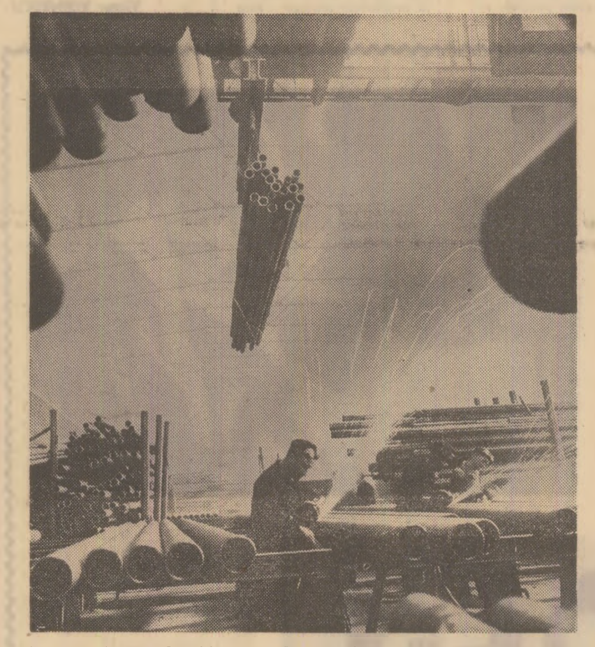
La uzina de jevi „Republica” din Capitală, livrarea unor produse de bună calitate ocupă un loc de prim ordin în preocupările colectivului. În acest scop, cum se vede în fotografie, se acordă o mare atenție finisării jevilor din oțel.

Stabilirea unor norme de muncă științific fundamentate, care în seama de timp real necesar pentru efectuarea lucrărilor, a permis, totodată, utilizarea mai bună a capacităților de producție, a mașinilor și a tehnicii realizate de muncii și de muncitorii din țară. În sase luni, planul productivității muncii a fost îndeplinit în proporție de 100,5 la sută, obținîndu-se față de realizările perioadei corespunzătoare din anul precedent un spor de 14,6 la sută. Nemulțumit a crescut și salariul mediu, acesta fiind cu peste 9 la sută superior față de nivelul atins în aceeași perioadă a anului trecut. În perioada de aplicare experimentală a noului sistem de salarizare, au apărut însă unele anomalii și neclarități care se cer elucidate cit mai repede. Este vorba, în primul rînd, de inexistența unei diferențieri muncii în funcție de salarizare anurilor meseriei care prezintă un grad de dificultate și complexitate diferit. Bunoară, judecînd după specificul grupului nostru de uzine, deși muncitorii strungarii, frezarii și rectificatorii au un grad de pregătire profesională mai ridicat și un consum mai mare de energie, aceștia au aceeași încadrare în categorii și trepte ca și lăcătușii ce lucrează în acord sau regie, primind același salariu tarifar or de încadrare, fără a exista vreo diferențiere în rețeaua tarifară. În afară de aceas-