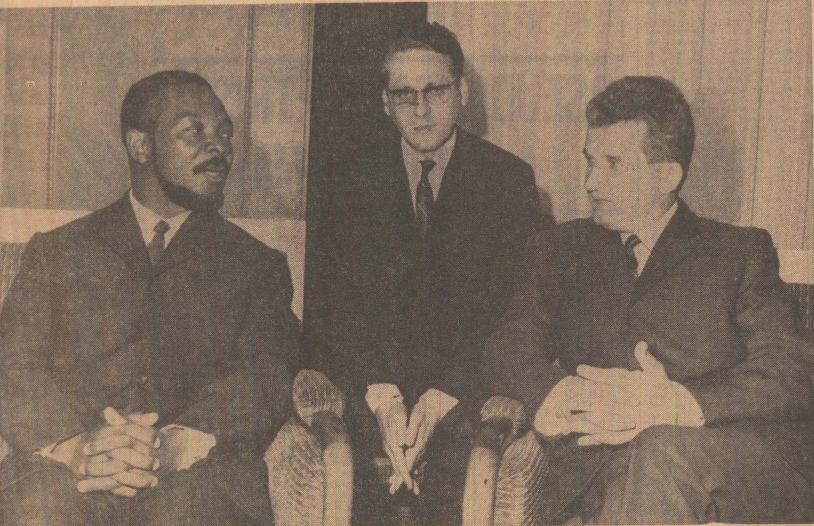
În timpul vizitei protocolare