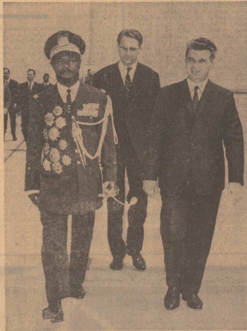
La sosire pe aeroportul internațional „București — Otopeni”