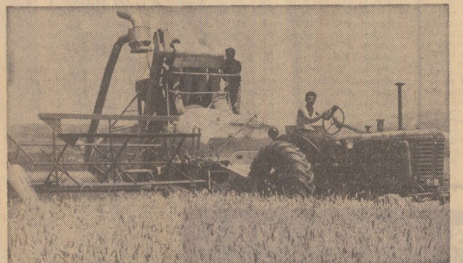
Mecanizatorii care lucrează pe taratele cooperative agricole din Ploiești, județul Prahova, depășesc zilnic viteza de lucru prevăzută la recoltatul grîului

Citiți în pag. a III-a rîndul anchetă: „Viteză zilnică maximă la recoltatul grîului!”