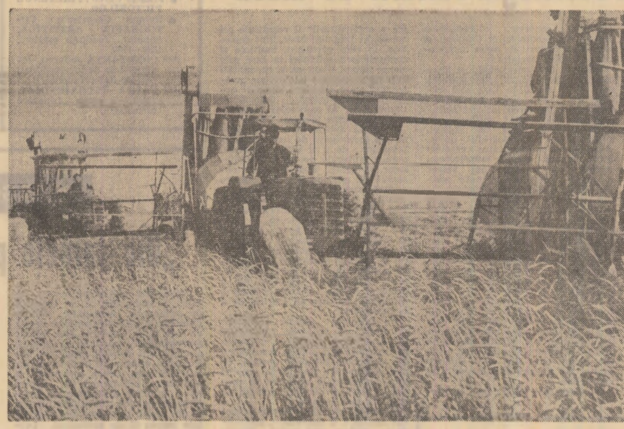
Recoltatul grîului la stajiunea experimentală agricolă din Caracal, județul Olt.