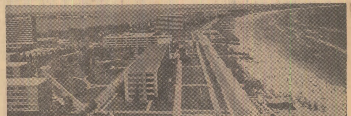
Într-o parte — marea, în cealaltă — locul Sighetului. În mijloc, pe limba de pămînt, „Mamaia”, una dintre cele mai frumoase stațiuni ale litoralului