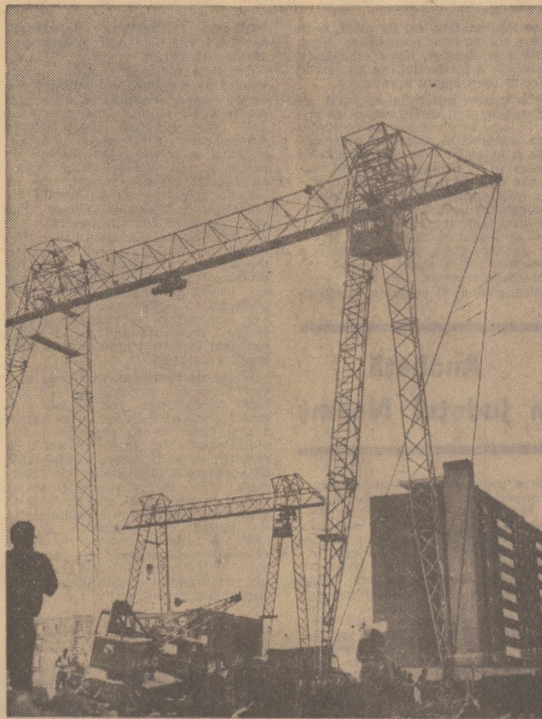
Unul din șantierele orașului Satu Mare, afiț de năpraznic lovit de furia apelor. Se construiesc, din fondurile statului, 1.650 noi apartamente, peste prevederile inițiale din acest an.

plimentare în valoare de 128 milioane lei, iar fostierii de la unitatea din Tg. Secuiese — un volum de produse de peste 90 milioane lei. Recentele analize făcute de către adunările generale ale salariaților din întreprinderi au scos în evidență rezerve noi care, valorificate, vor asigura anul acesta importante economii de materiale și creșteri ale productivității muncii, ceea ce va duce la realizarea și depășirea angajamentelor luate în anul în curs, constituind premise sigure pentru îndeplinirea sarcinilor în condiții superioare a primului an al cincinalului 1971-1975. Asigurăm conducerea partidului și statului nostru, pe dumneavoastră personal, iubite tovarășe Nicolae Ceaușescu, că și în viitor, colectivele de muncă din județul nostru, însușite de prețioasele indicații expuse la plerana din iulie, vor face totul ca mărșetele și complexele sarcini ale cincinalului următor stabilite de Congresul al X-lea al P.C.R. să fie în întregime realizate și depășite, convingînd astfel că prin aceasta contribuim la prosperitatea și înflorirea continuă a scumpelor noastre patrii — România socialistă. COMITETUL JUDEȚEAN DE PARTID COVASNA