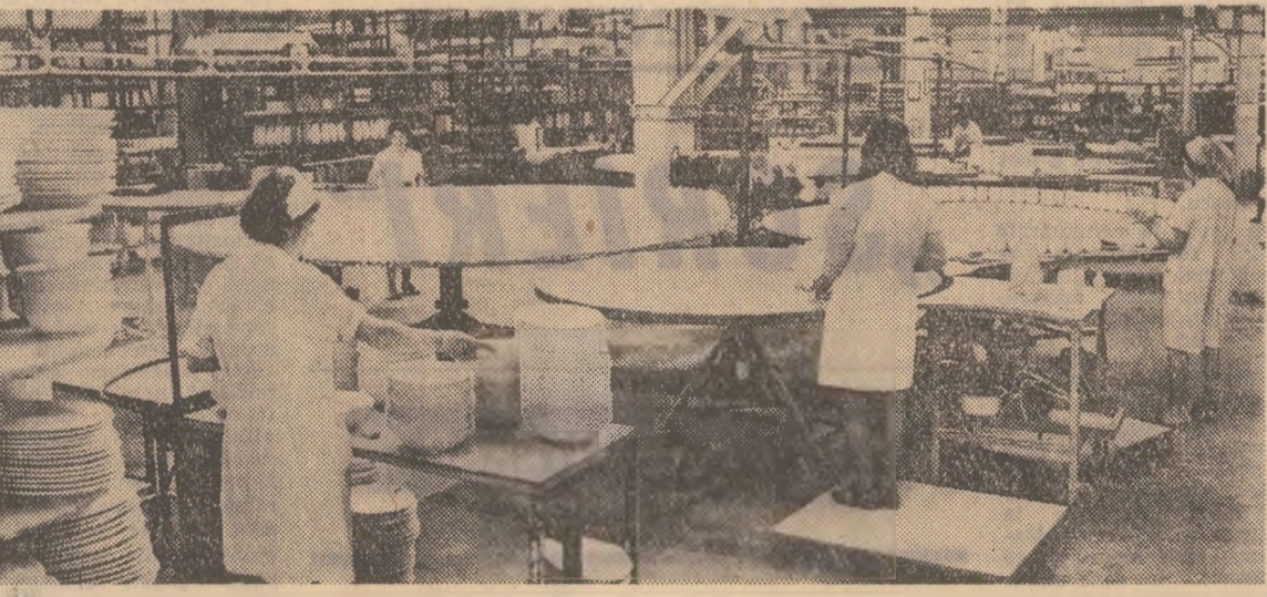
Combinatul de siderie din Sighișoara — una din unitățile de prestigiu ale industriei ușoare, ale cărei produse și-au „câștigat un nume” atît în țară, cît și peste hotare. În fotografie: aspect din secția de turnare a vaselor.