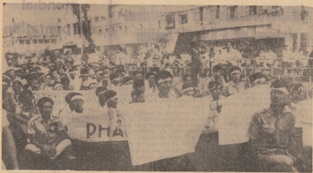
Demonstrație de protest la Saigon împotriva continuării războiului de către administrația Thieu-Ky, pentru retragerea trupelor americane din Indochina