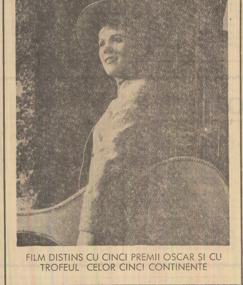
FILM DISTINS CU CINCI PREMII OSCAR SI CU TROFEUL CELOR CINCI CONTINENTE