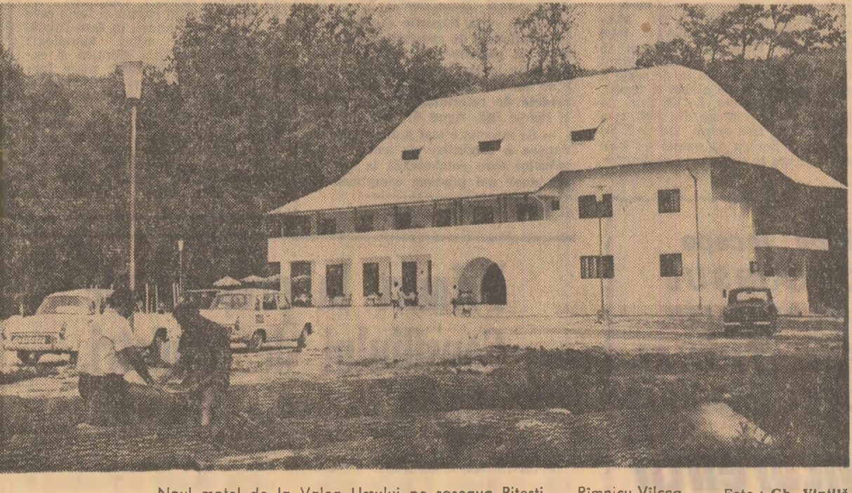
Noul motel de la Valea Ursului pe șoseaua Pitești — Rimnicu-Vilcea