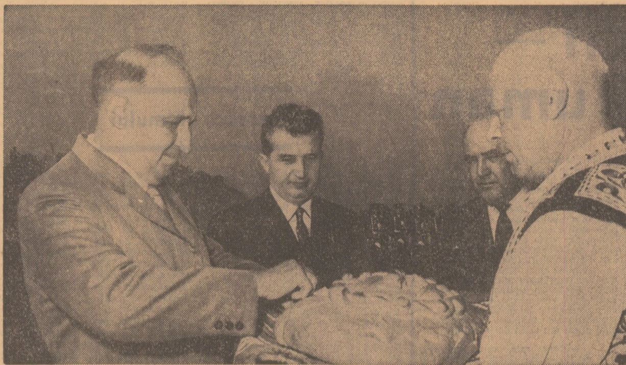
În semn de bun venit, oaspeții sînt îmbrățișați să guste din piine și sare

Manifestînd preocupare față de eficiența economică realizată, tovarășul Todor Jivkov solicită lămuriri cu privire la costul investițiilor, la organizarea muncii. Răspunzînd întrebărilor adresate, specialiștii arată că datorită măsurilor luate pentru perfecționarea fluxului tehnologic, parametrii proiectați au fost realizați cu un an mai devreme decît era prevăzut. Oaspeților le sînt expuse detalii asupra sistemului de epurare a apelor uzate, asupra modalităților folosite pentru a asigura condiții de igienă corespunzătoare. Intreținîndu-se cu un grup de muncitori din cadrul acestui complex, tovarășii Todor Jivkov îi felicită pentru realizările obținute și li se adresează: „Voi nu mai sînteți țărani; sînteți muncitori industriali!”