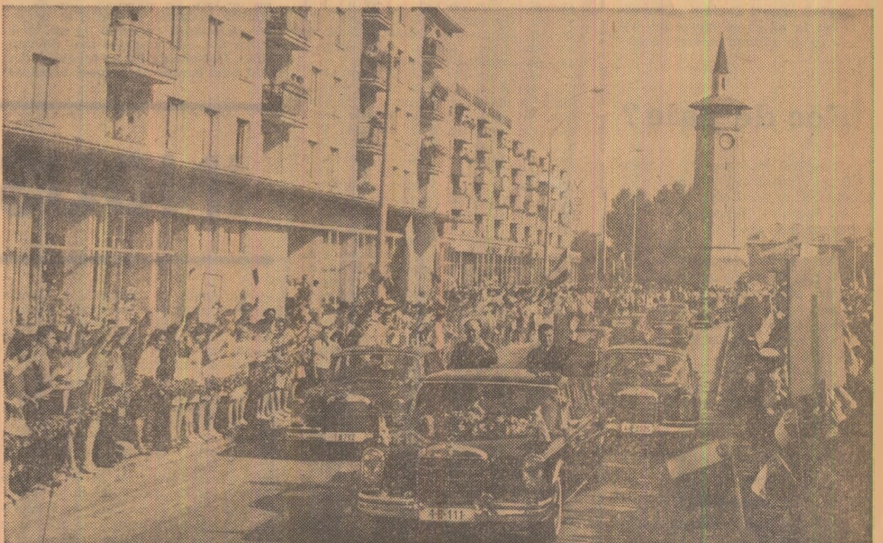
Locuitorii orașului Giurgiu fac o primire caldă, entuziastă înalților oaspeți,

DEVA (Correspondența „Scînteii”, Sabin Ionescu) — La Combinatul siderurgic Hunedoara a început construcția unui nou furnal (nr. 9), cu o capacitate de 1.000 m.c. Întregul proces de producție va fi mecanizat și automatizat. În aceste zile, se efectuează lucrări de excavare și fundațiile metalurgice București. Instalările, aparatura și diferitele construcții metalice aferente furnalului vor fi executate, în cea mai mare parte, în principalele uzine și întreprinderi ale industriei construcției de mașini din țară.