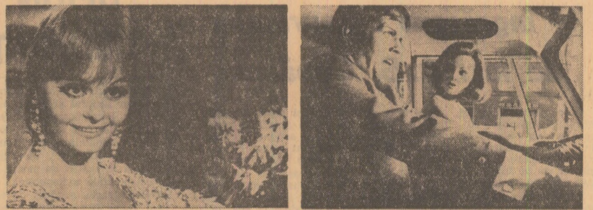
Producție a studiourilor spaniole, după comedia muzicală a lui Gonzales del Castillo, Munoz Roman, Francisco Alonso. Cu: Rocio Durcal, Isabel Garcés, Alfredo Landa, Celia Gámez