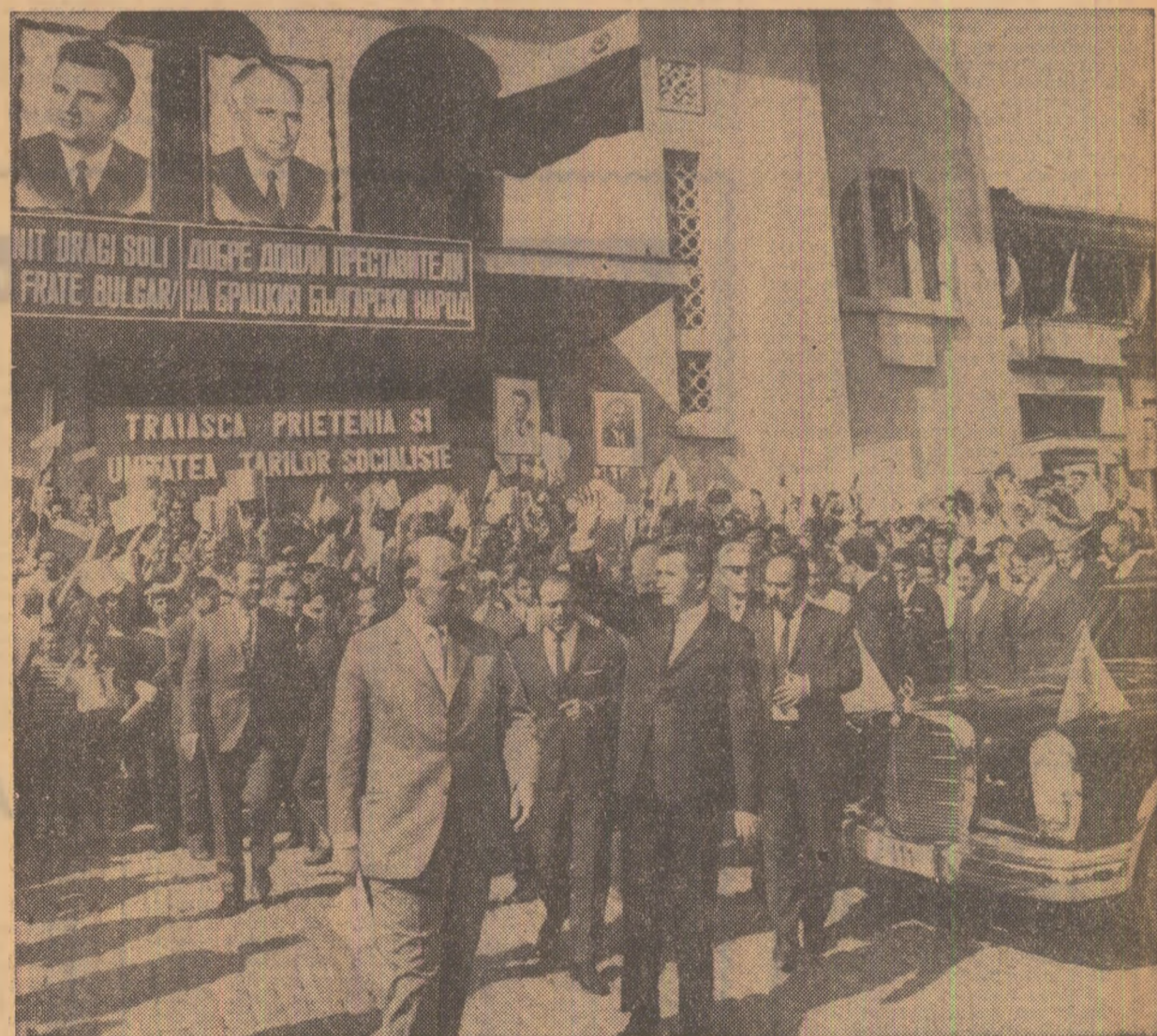
Prelutidendi, populația a manifestat cu căldură pentru întărirea prieteniei româno-bulgare.

„Noi — a spus vorbitorul — sîntem spre sfîrșitul convorbirilor. Vreau să mă asociez aprecierii făcute de tovarășul Ceaușescu, că, într-adevăr, aceste convorbiri au decurs într-un spirit de înțelegere recipro-