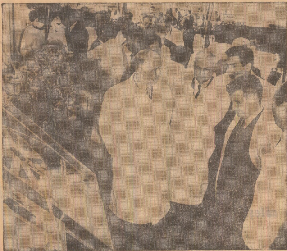
La Complexul de creștere și îngrișare a taurinelor de la I.A.S. Copăceni