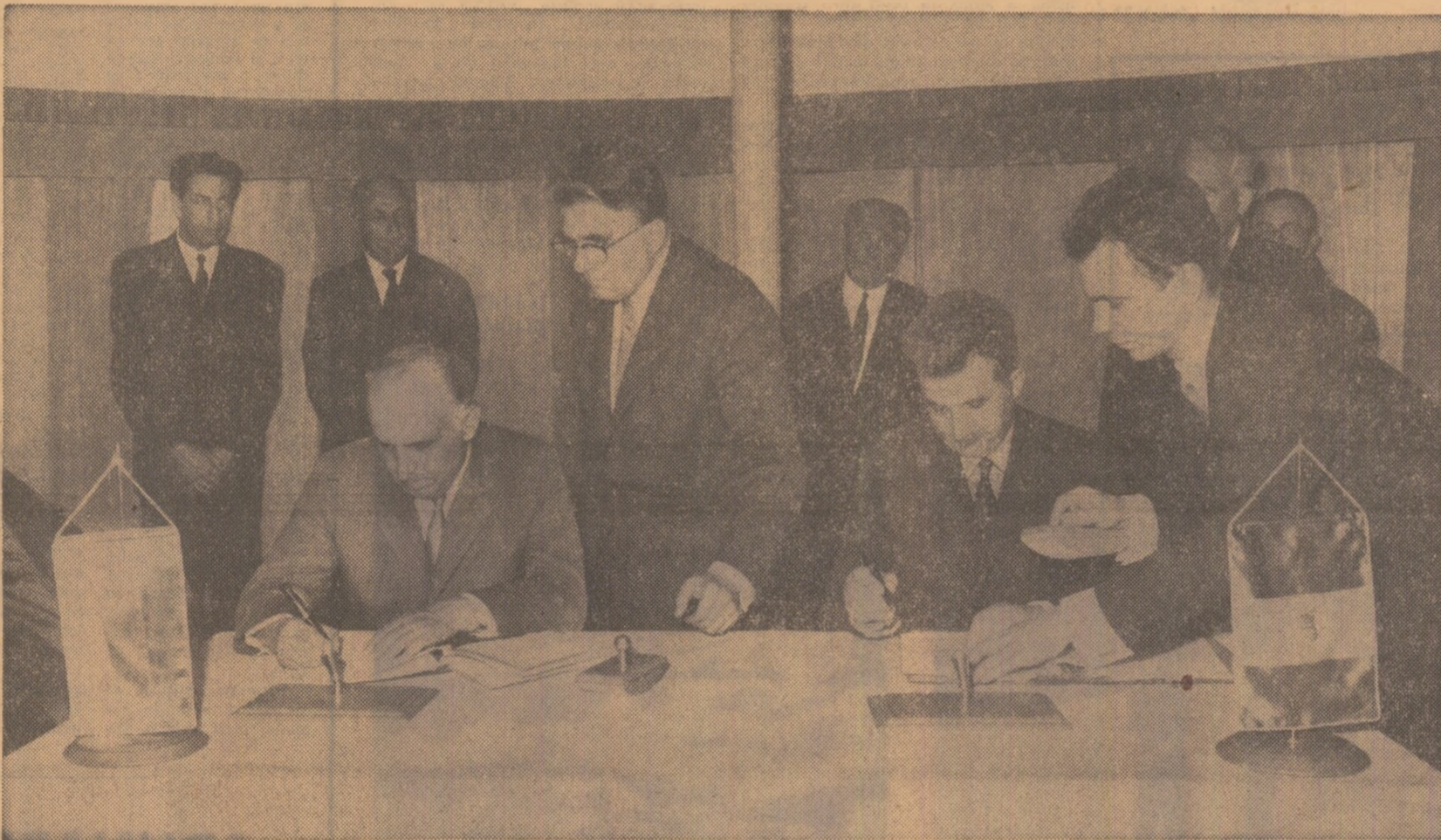
La semnarea unor protocoale privind dezvoltarea relațiilor româno-bulgare

O gardă militară prezintă onorul. Se întonează imnurile de stat