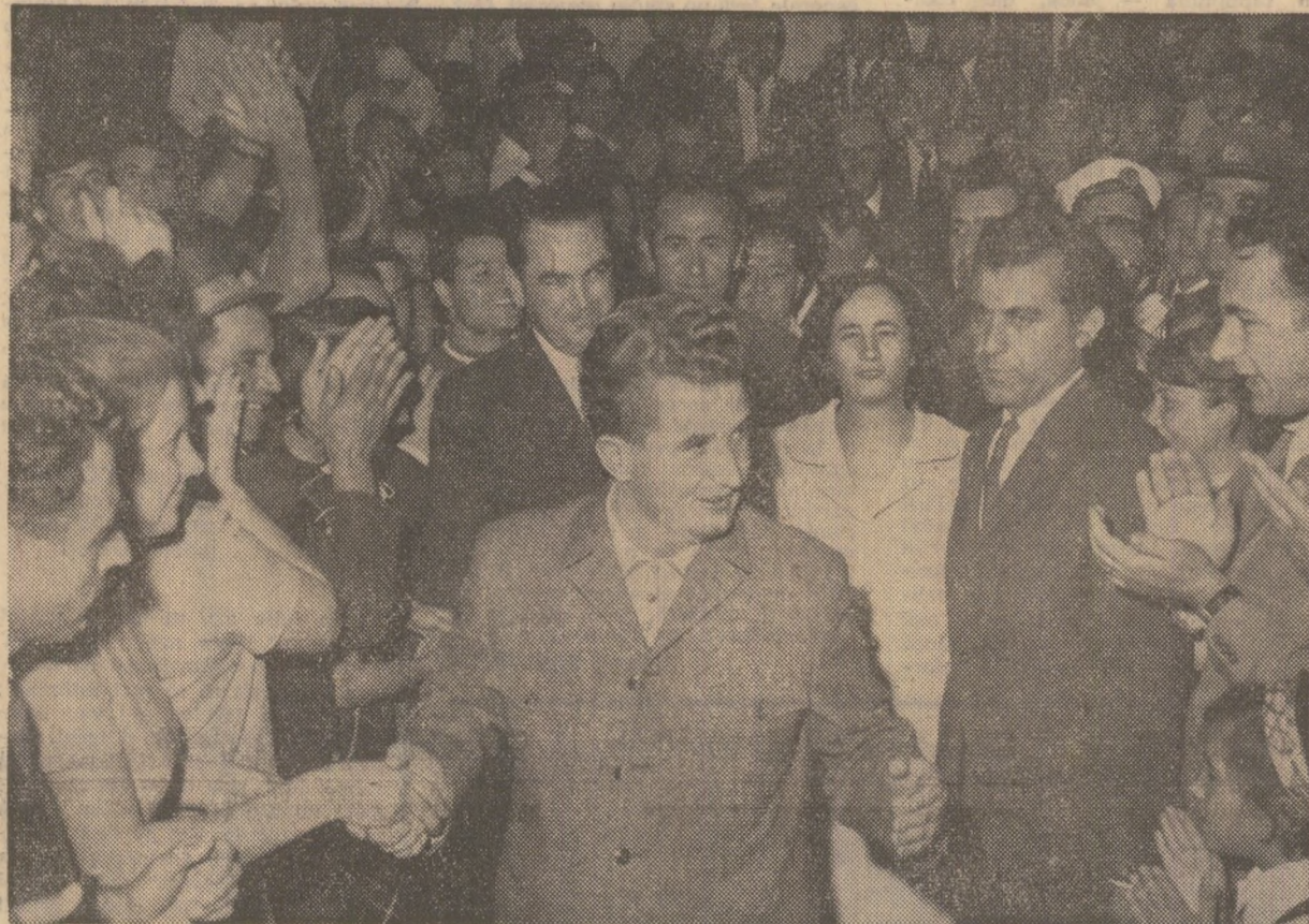
La Galați oaspeții dragi sînt salutați cu deosebită căldură

Sînt aici constructorii și oțelarii de la combinatul siderurgic, constructorii de nave, muncitorii, inginerii, tehnicienii care lucrează în puternicile întreprinderi ale orașului. Cei ce se află acum în port își amintesc că în această primăvară, cînd apele Dunării creșteau amenințătoare, secretarul general al partidului a fost în mijlocul lor, îmbărbătîndu-i, dîndu-le încredere și sprijin în lupta cu stihiele dezlănțuite. Ei îl salută pe tovarășul Nicolae Ceaușescu cu stîmă și recunoștință pîrînd în inimă bucuria și mîndria îndeplinirii înainte de termen a sarcinilor planului cincinal, hotărîrea de