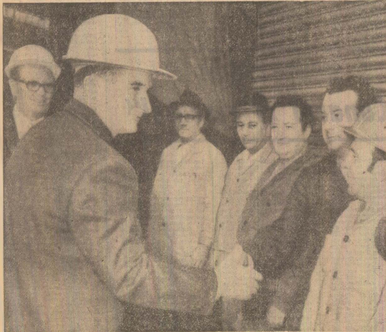
„Glückauf” — un salut muncitoresc pentru președintele Ceaușescu