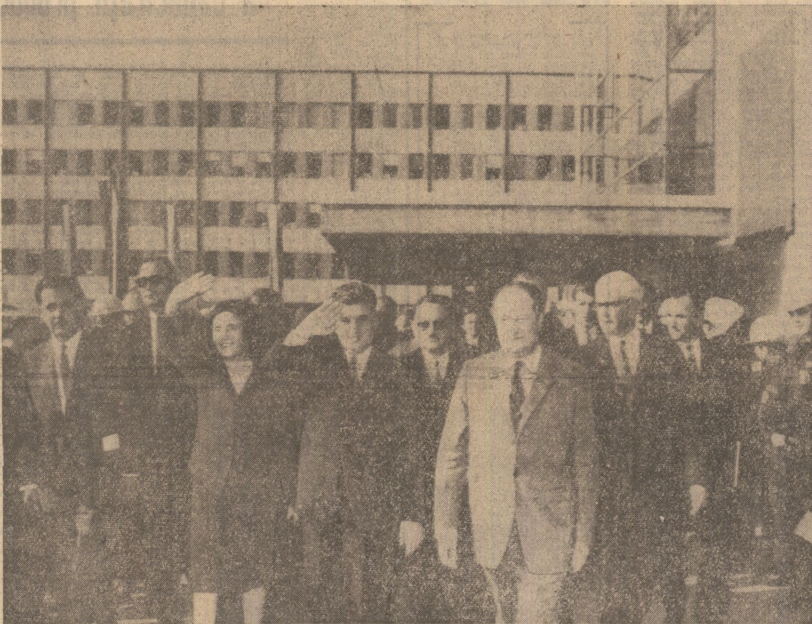
La uzinele „Voest”, împreună cu cancelarul Bruno Kreisky și un grup de specialiști