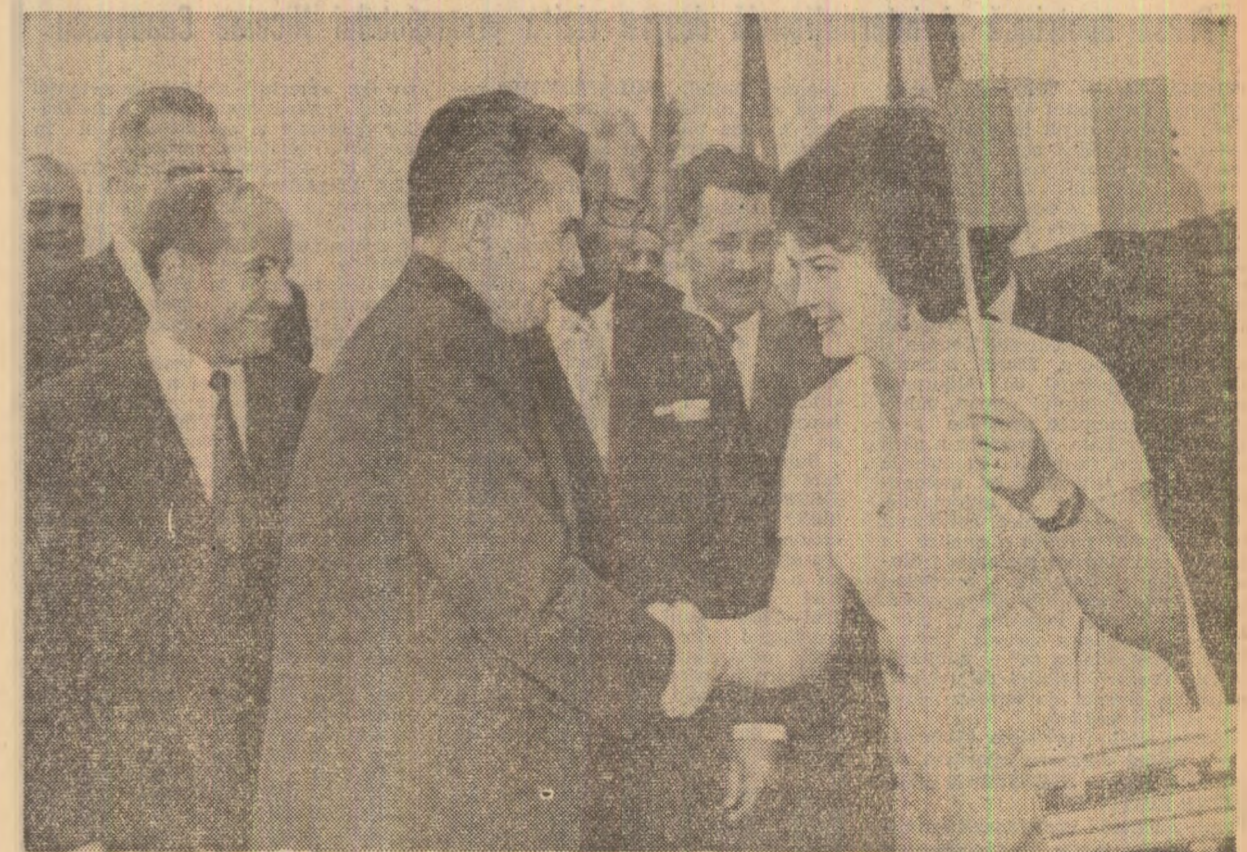
„Trăiască prietenia dintre Austria și România!”