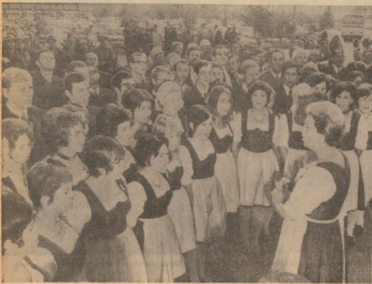
Acest cor intonează vechiul cântec austriac „Pentru oaspetele drag sosit în pragul casei” — încă o expresie a căldurii și prejuriilor cu care președintele român a fost întâmpinat la Linz