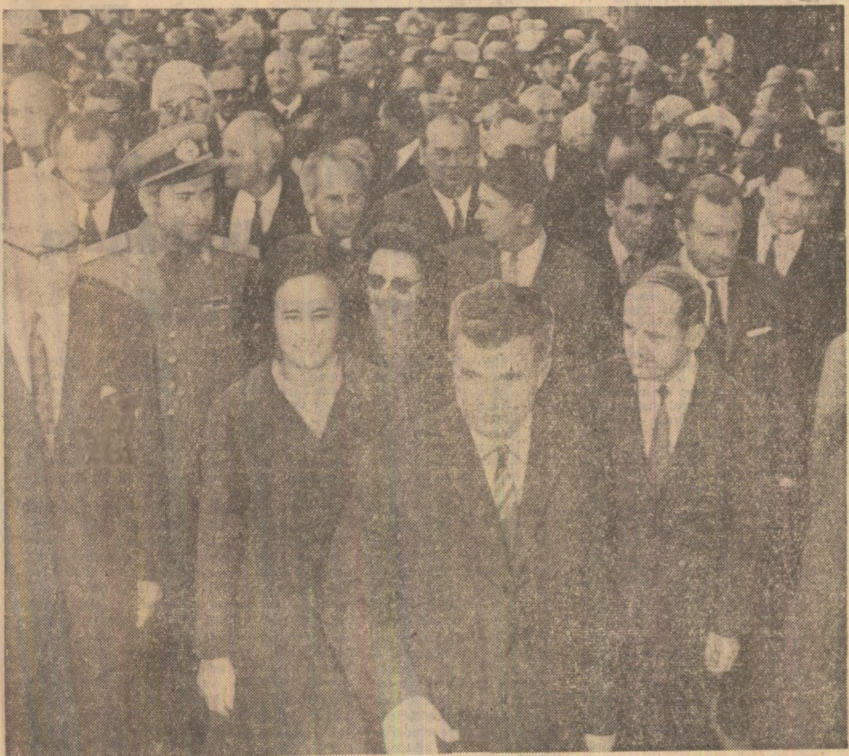
Primire călduroasă la Linz

Președintele Republicii Federative a Braziliei