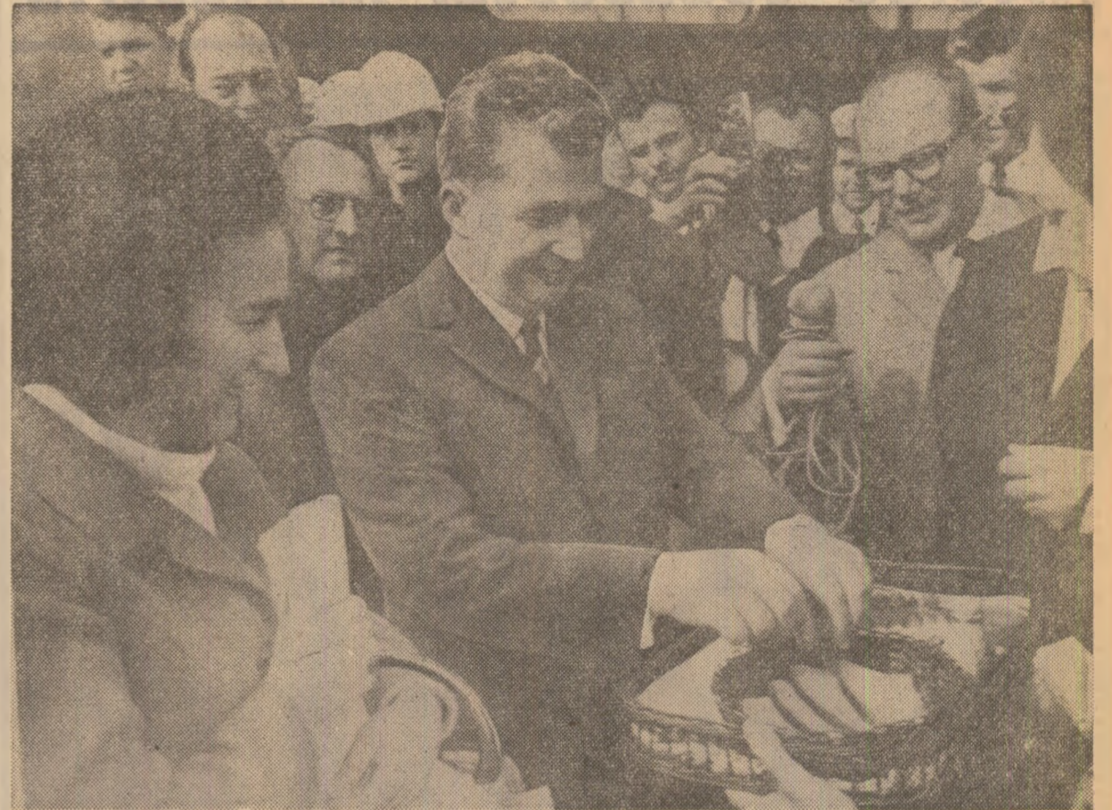
O tradiție asemănătoare în formă, identică în semnificații cu datina românească — ospitalitate, căldură prietenească

Dar, oricît am fi de preocupați de Europa, nu putem să nu avem în vedere că astăzi pacea este indivizibilă, că un conflict în orice parte a lumii influențează asupra tuturor popoarelor de pe toate continentele. De aceea, acordînd o atenție deosebită problemelor legate de securitatea europeană, nu