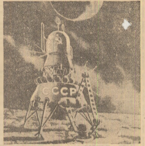
Desen apărut în ziarul „Pravda”, reprezentând stația automată sovietică „Luna-16”, pe satelitul natural al Pământului.