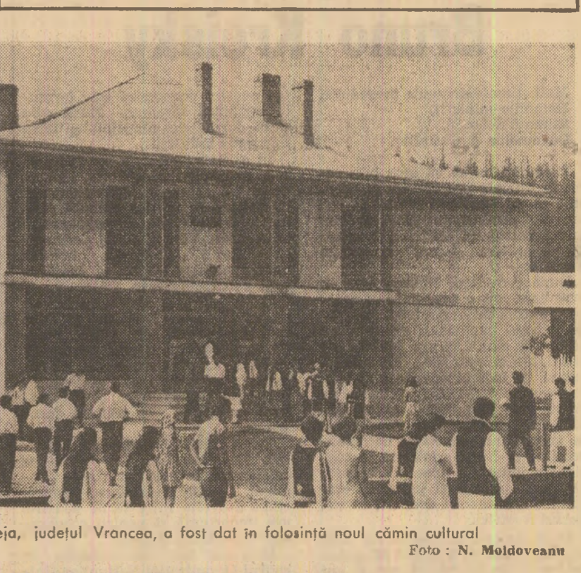
Recent, în comuna Soveja, județul Vrancea, a fost dat în folosință noul cîmin cultural.