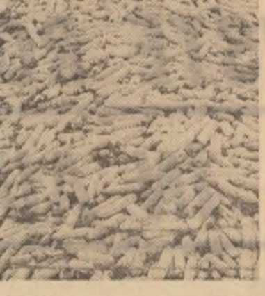
La cooperativa agricolă Sf. Gheorghe (în fotografia de sus) porumbul, aruncat din căruțe la întimplare în curtea sectorului zootehnic, se risipește. Mai bine s-ar risipi cei care nu știu să prețuiască avutul obținut.