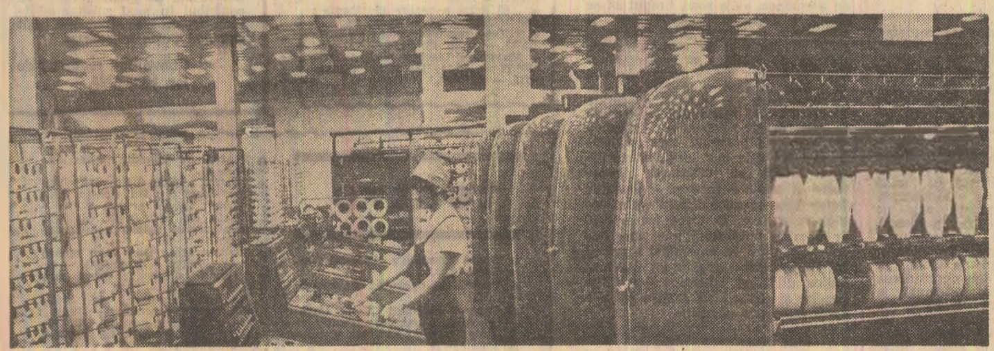
Uzina de fibre sintetice Săvinești: în peisajul tehnicii moderne

Din investigațiile făcute pe cîteva santerii se desprinde însă că, fără a diminua vîna unor constructori, foarte multe neajunsuri își au obîrșia tocmai din modul defectuos în care unul beneficiar și ministerul rezolvă problemele asigurării la timp