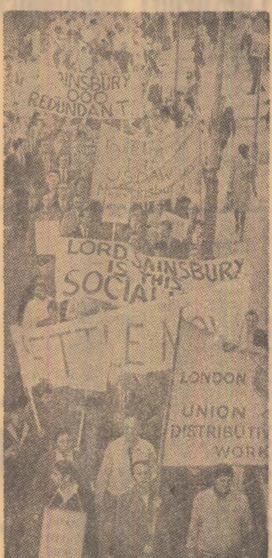
Demonstrație pe străzile capitalei britanice împotriva concedierilor