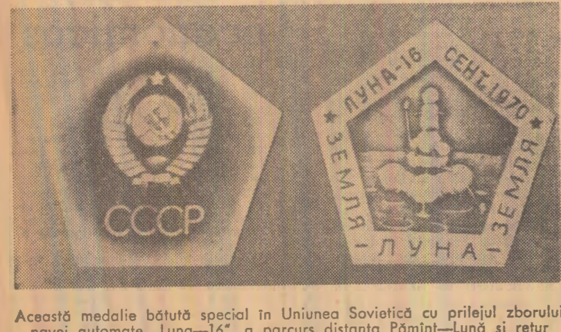
Această medalie bătută special în Uniunea Sovietică cu prilejul zborului navei automate „Luna-16“ a parcurs distanța Pămînt-Lună și retur