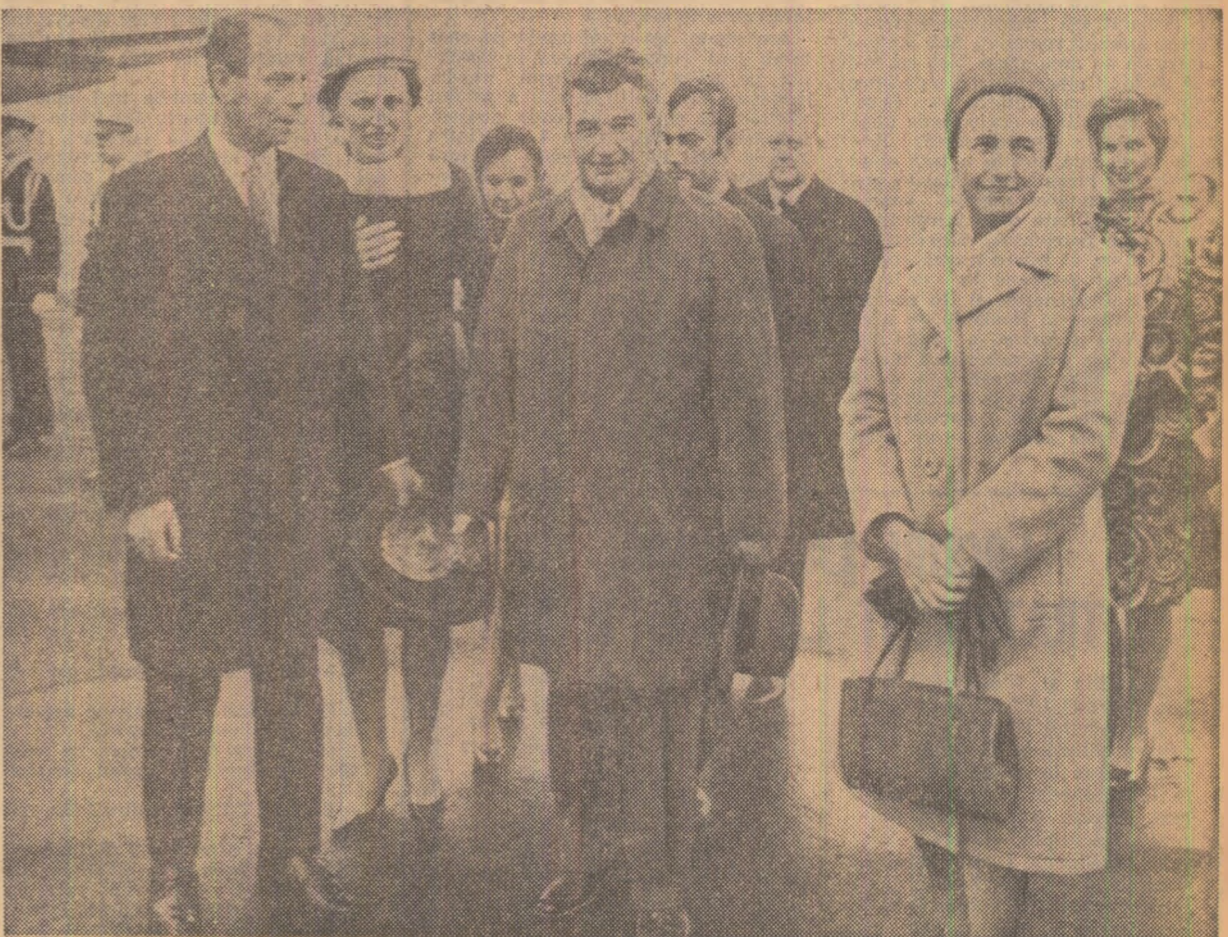
Președintele Consiliului de Stat al Republicii Socialiste România i s-a făcut o primire cordială pe aeroportul Keflavik