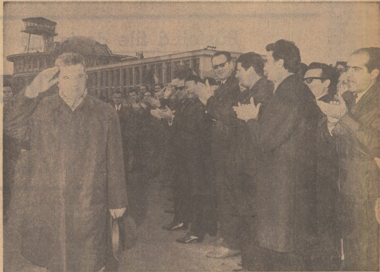
La plecare, pe aeroportul Băneasa