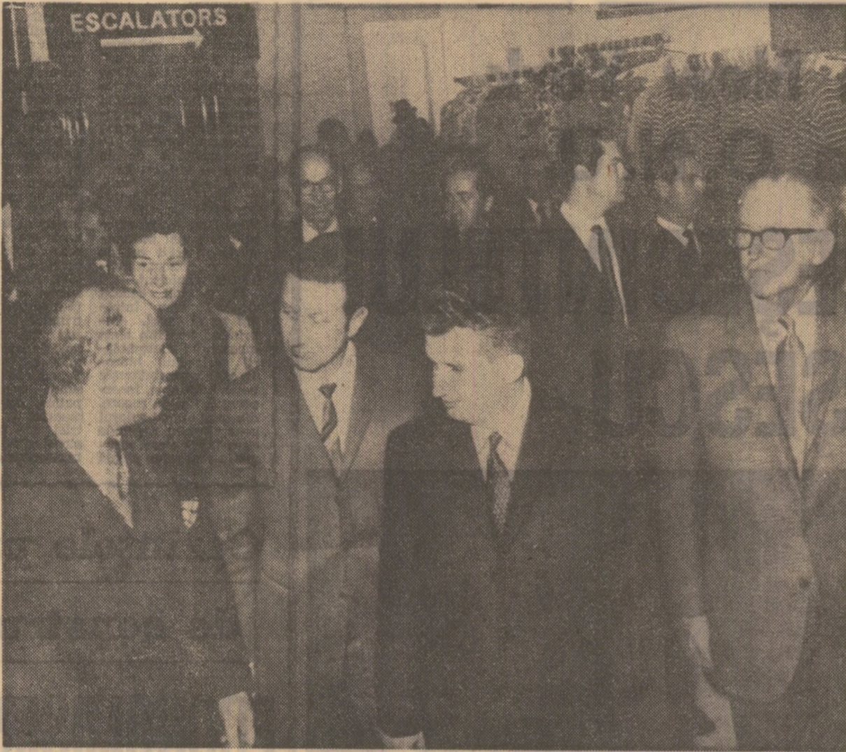
Intr-unul din raioanele marelui magazin Macy's din New York

Aș dori, de asemenea, să adaug că adeziunea entuziastă, totală, a întregului nostru popor la ideile luminoase enunțate în cuvîntarea tovarășului Nicolae Ceaușescu izvorăște totodată din faptul că poporul este ei însuși „coautor” efectiv al politicii interne și externe a partidului și statului. Ne spunem cuvîntul, cu toții, în fiecare din problemele majore ale dezvoltării patriei — și vedem cum, ca o „prelungire” a acestei concepții,