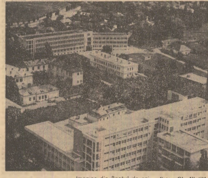
Imagină din Bacăul de azi