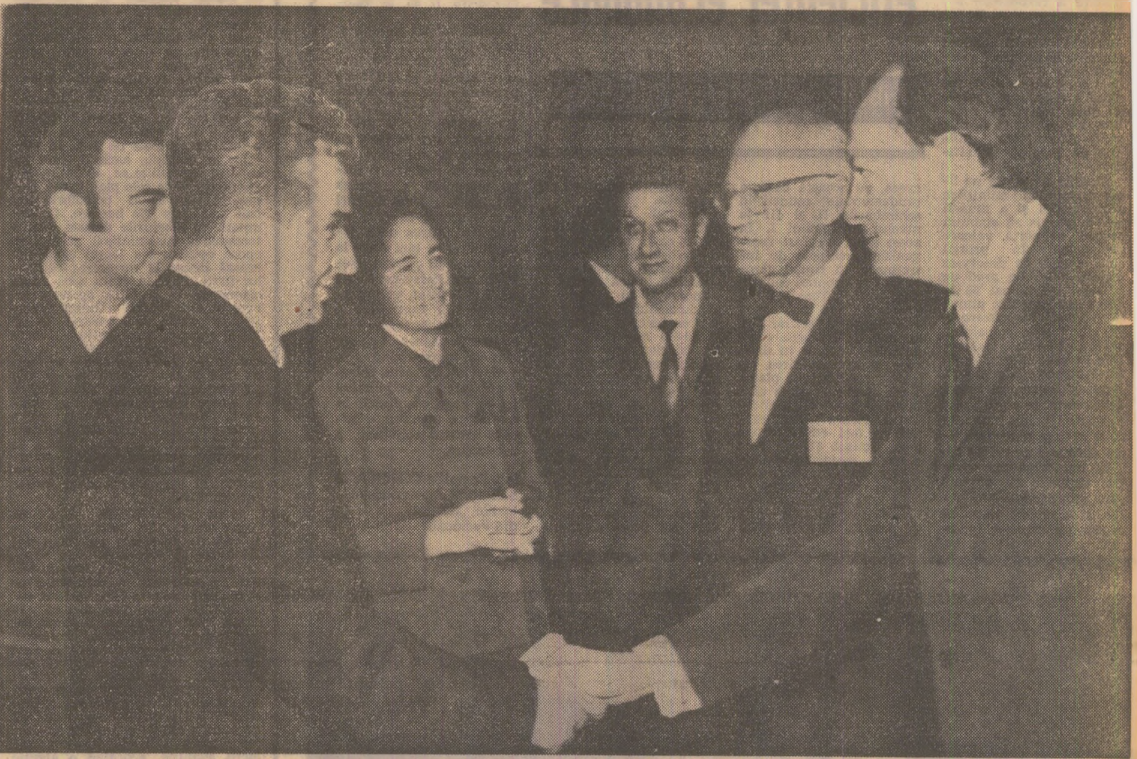
Președintele Nicolae Ceaușescu și soția sa, Elena Ceaușescu, călduros salutați cu prilejul prezenței lor la Asociația de politică externă din New York