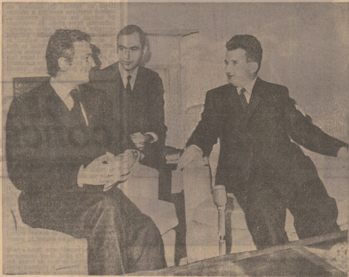
În timpul întrevederii cu primarul New York-ului

Primarul J. Lindsay a înmănat președintelui Nicolae Ceaușescu medalia jubiliară emisă de municipalitatea orașului New York cu prilejul jubileului Organizației Națiunilor Unite.