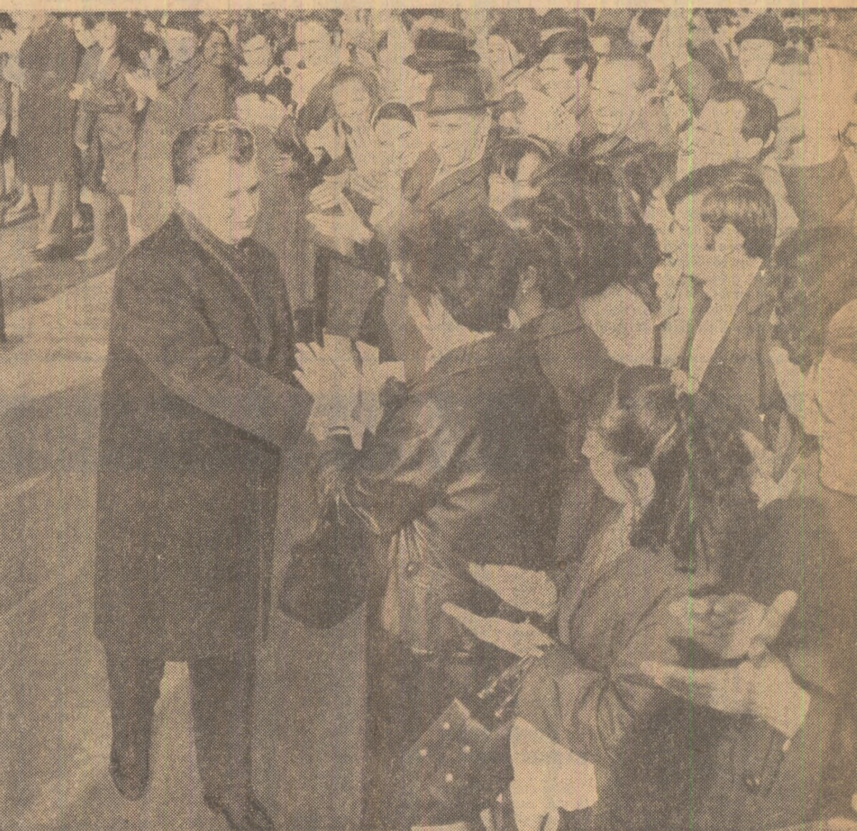
Tovarășul Nicolae Ceaușescu răspunde cu căldură aclamațiilor, strînge mîna a numeroși cetățeni veniți în întîmpinare

Excelenței Sale Domnului CEVDET SUNAY Președintele Republicii Turcia