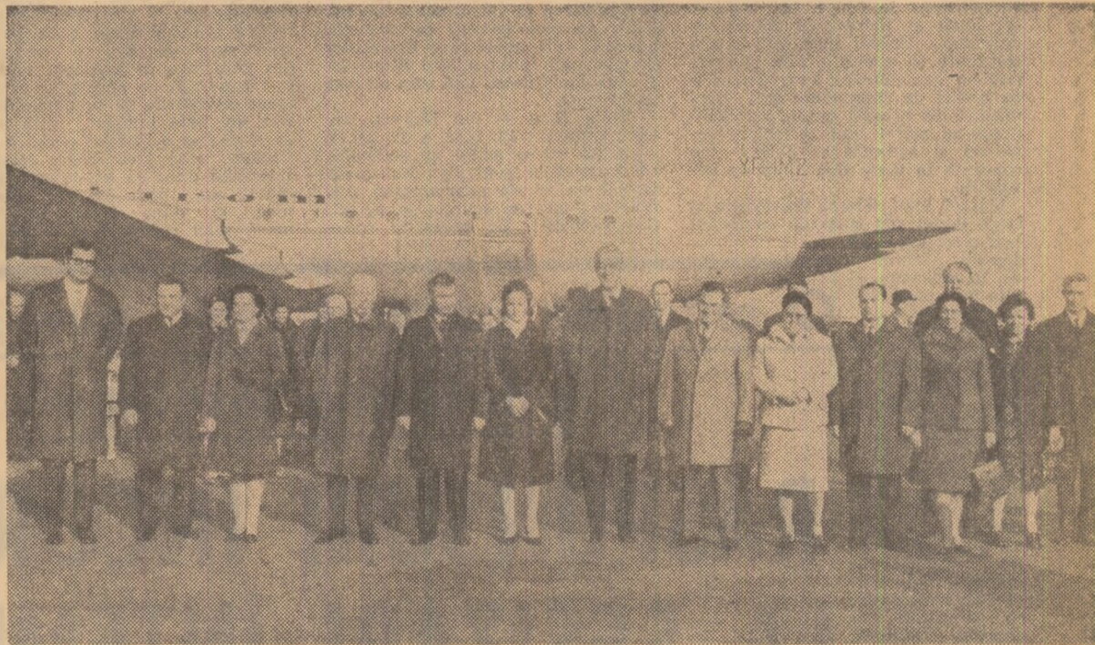
La sosire, pe aeroportul Băneasa

Miercuri la amiază s-a înapoiat în Capitală tovarășul Nicolae Ceaușescu, președintele Consiliului de Stat al Republicii Socialiste România, care a participat la lucrările sesiunii jubiliare a Organizației Națiunilor Unite, prilejuită de aniversarea a 25 de ani de la crearea acestui înalt for internațional.