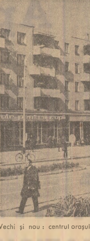
Vechi și nou: centrul orașului Giurgiu propune o nouă variantă pentru un binecunoscut cuplu

Am conceput și realizat instalațiile de termoficare pentru un anumit număr de apartamente, cu unele rezerve de capacitate în plus, fîșese. Dar cînd am început Indesirile și s-a ajuns cu căldura pe mîche de cuțit, au apărut provizoriile. De regulă, în asemenea cazuri forțele, se reduce cota de apă menajeră, pentru a se creștea o capacitate destinată încălzirii apartamentelor noi.