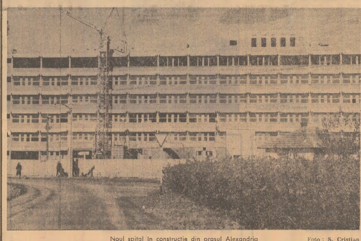
Noul spital în construcție din orașul Alexandria.