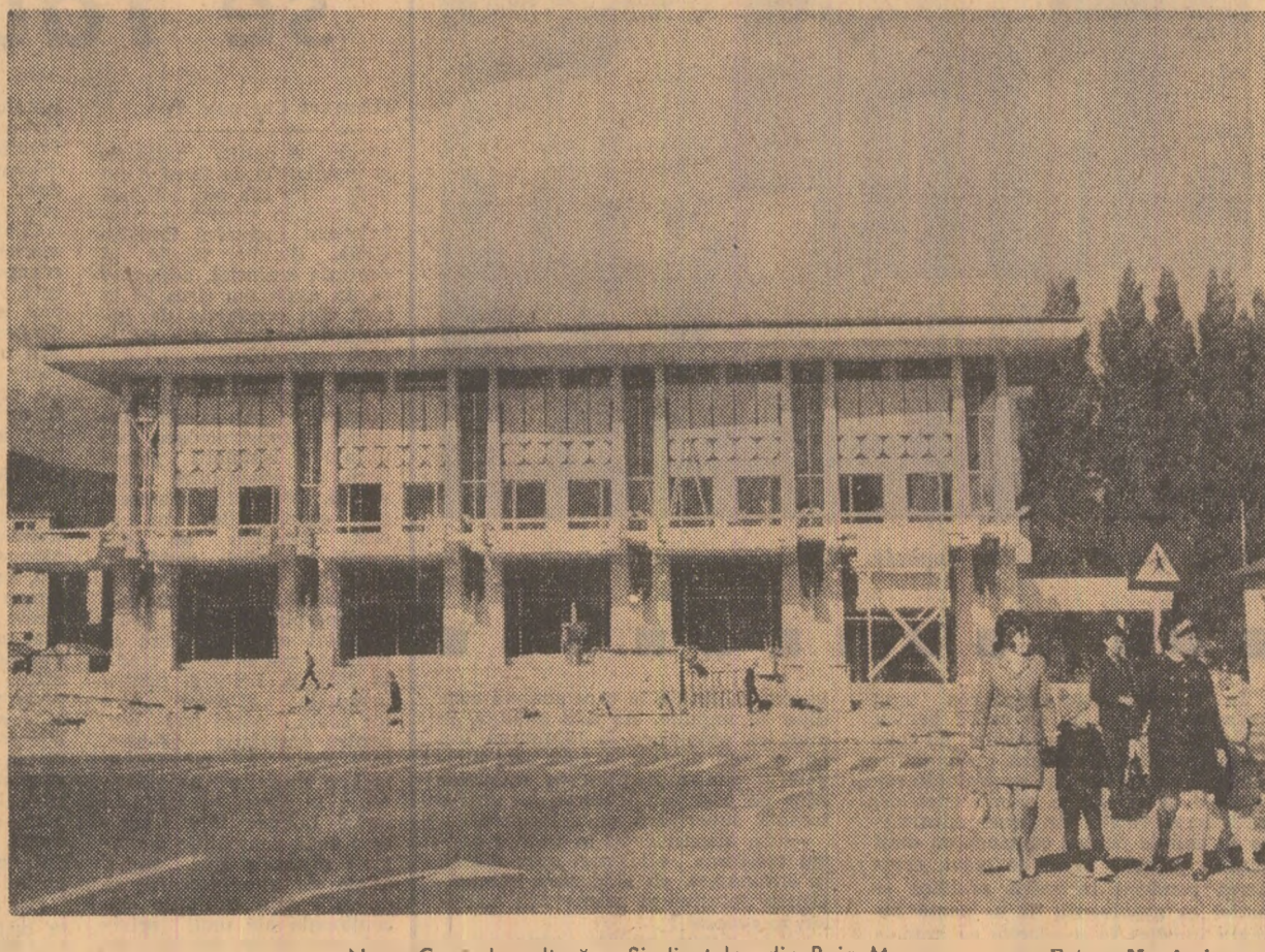
Noua Casa de cultură a Sindicatelor din Baia Mare