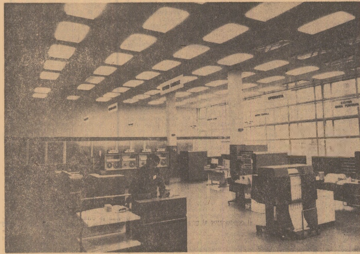
Sala calculatoarelor de la CEPECA

programarea producției etc.) nu trebuie gândite ca niște compartimente izolate, între ele existând nenumărate legături, atât în interiorul calculatoarelor electronice (prin intermediul fișierelor principale), cât și în întreprindere (prin schimbarea de informații dintre diferitele utilizatori). Realizarea unui sistem „integrat”, care să răspundă tuturor acestor cerințe, reprezintă rodul activității specialiștilor în folosirea calculatoarelor (analiștii sau programatorii), al colaborării acestora cu ceilalți salariați, sub îndrumarea conducerii întreprinderii. Contribuția acestor specialiști va fi cu atât mai eficientă, cu cât conducerea, la diferitele niveluri ale întreprinderii, va reuși să se adapteze mai bine la acest nou tip de activitate.