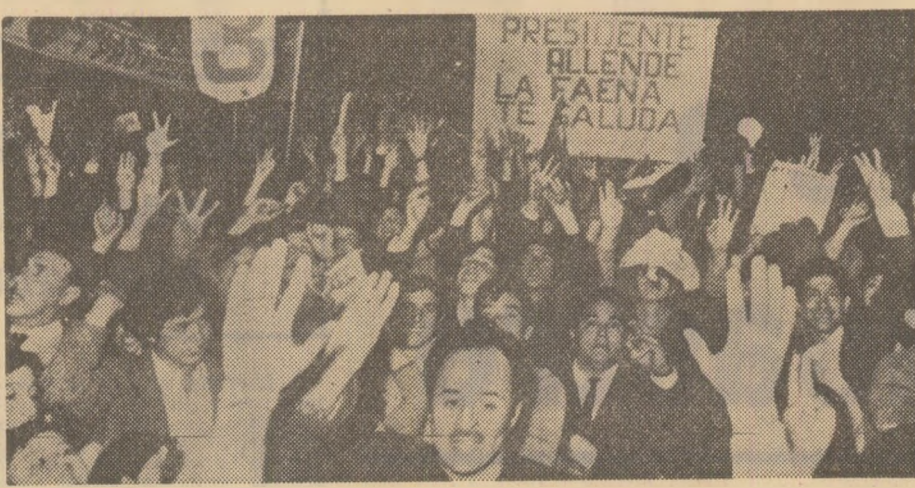
Mulțimea din capitala chiliană salută victoria în alegeri a președintelui Allende