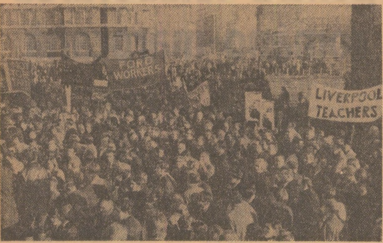
Miting revendicativ la Liverpool, la care a participat un mare număr de muncitori din diferite ramuri ale industriei britanice