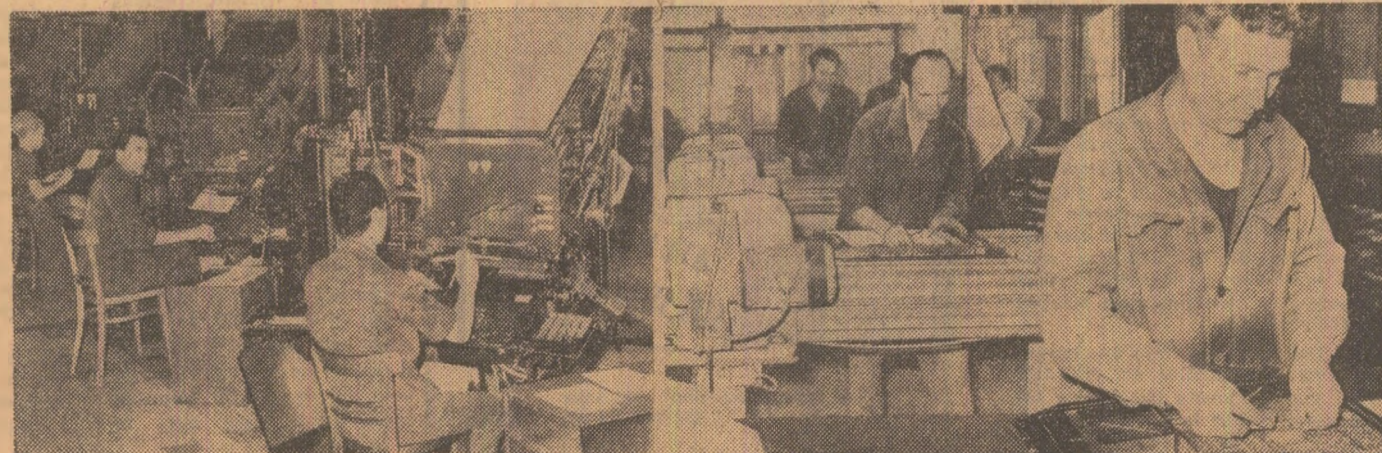
Culegătorii și paginatorii — colaboratorii noștri apropiați. Imagine din atelierele unde se lucrează ziarul nostru la Casa Șcînteii

Avem o zi a tipografulor, așa cum avem o zi a minciunilor, a detorziilor, a construcțiilor sau a oamenilor recoltei. Avem o zi consacrată unei profesii care înseamnă, deopotrivă, și forajul de adîncime, deschidînd noi orizonturi cunoașterii noastre, și construcție, și cules sau recoltă. Nu întîmplător, meșterul tipograf se numește „culegător”, „culegătorul de semne”, culegătorul acestor fructe de aur care închid, ca pe un miez feril și incandescent, ideea. Avem, însemnat, cu roșu în calendarul prețurii obștești, o zi — o sărbătoare consacrată omului care, aplicat pe fila de manuscris din care se naște ziarul sau cartea, ostenește la zidirea ideii, expunînd-o de pe pagina albă, ca de pe un soclu, privirii și înțelegerii oamenilor.