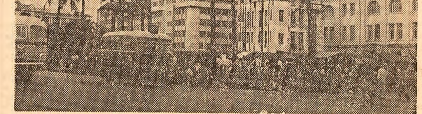
Pe o stradă din centrul capitalei — Rangon

Cometa și să le retragă definitiv din serviciu. Această hotărîre a fost luată în urma prăbușirii unui avion de acest tip în apropiere de capitala libiană. Catastrofa s-a soldat cu 16 morți. De asemenea, relevă presa egipteană, alte două accidente cu același tip de avion au avut loc, în această săptămîni, la Asmara și Amman.