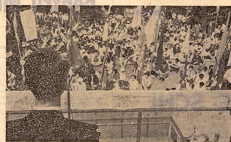
Demonstrație de protest împotriva prezenței bazelor militare americane pe teritoriul țării și amplasării de noi armate la aceste baze, desfășurată recent la Fussa City, în apropierea capitalei nipone

Pe de altă parte, din Londra se transmite că guvernul englez a anunțat că își va preciza atitudinea de îndată ce organizația ilegală își va face cunoscute condițiile pentru eliberarea ambasadorului britanic.