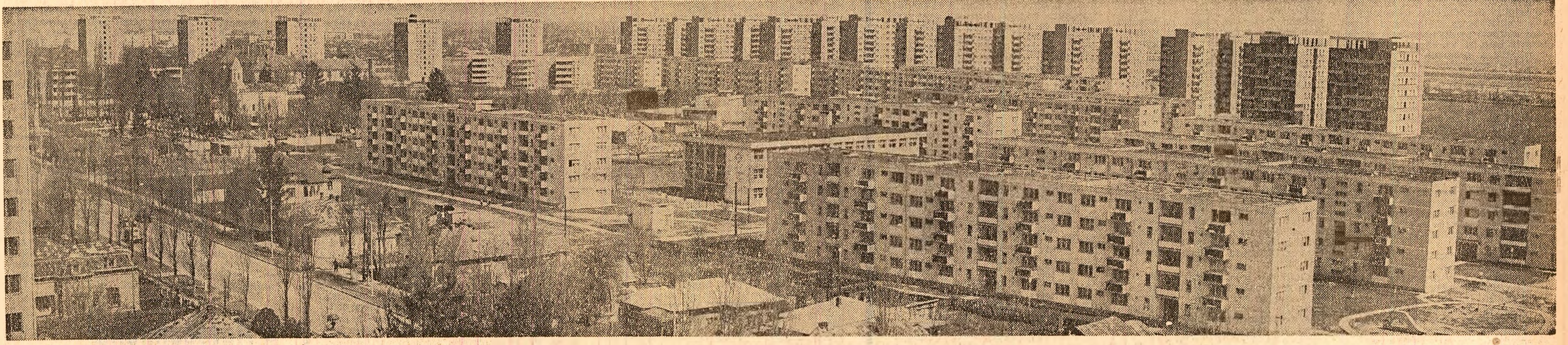
„CORNISA-BISTRITELI” — cel mai mare cartier din orașul Bacău (numără peste 4 000 de apartamente)

La orașe • Din fondurile statului și cu credite acordate de stat, în perioada 1966—1970 au fost construite 7716 apartamente • Numai în municipiul Bacău s-au mutat în case noi peste 20 000 de cetățeni • Au fost executate importante amenajări edilitare, printre care : 22 km rețele de distribuire a apei 49 km rețele de canalizare • În orașele Gheorghe Gheorghiu-Dej și Comănești s-a extins mult rețeaua de termoficare. La sate • S-au dat în folosință noi hoteluri turistice la Bacău și în municipiul Gheorghe Gheorghiu-Dej. • S-au construit 10 168 de case noi • NUMĂRUL SATELOR ELECTRIFICATE a crescut de la 184 cite erau în 1965 la 334 în anul 1970. • CONSUMUL DE ENERGIE ELECTRICA a crescut de 2,6 ori . • S-au construit 408 săli de clasă, 35 magazine, 3 cămine culturale, 2 dispensare.