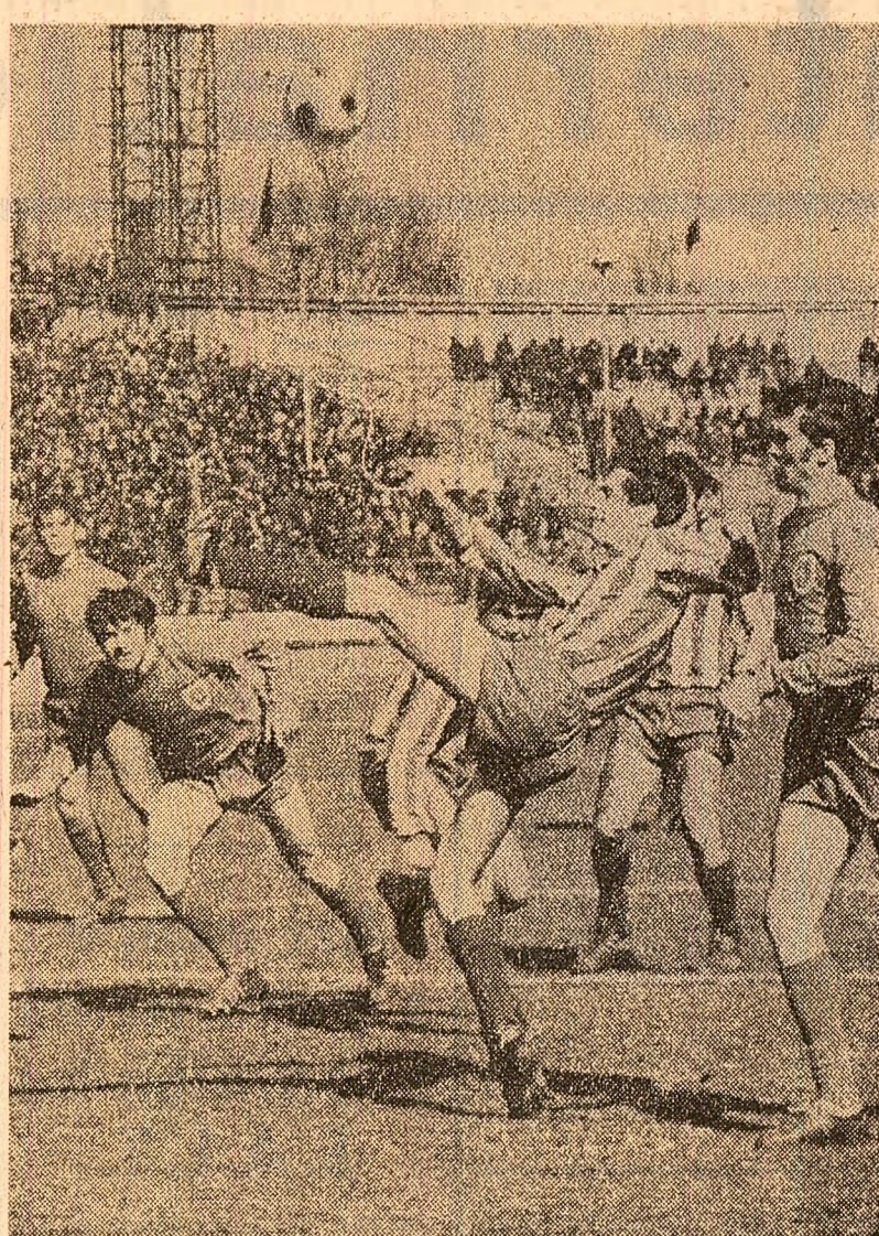
Primul punct înscris în retur (Rapid—U" Cluj, autor Neagu) și... lupul vană, fără goluri (Steaua—Farul 0-0)