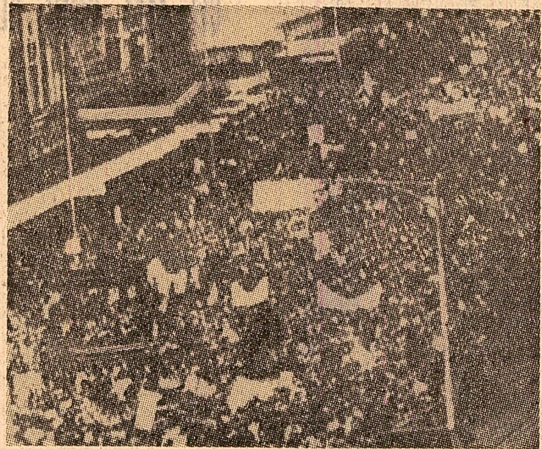
Demonstrație la Canberra, împotriva escaladării agresiunii în Indochina și a participării trupelor australiene la operațiunile agresive din Vietnamul de sud. După cum se știe, tocmai această participare a fost unul din factorii principali care au dus la recenta demisie a guvernului Gorton.

ANKARA 14 (Agerpres). — Președintele Republicii Turcia, Cevdet Sunay, a analizat sîmbătă cu șefii forțelor armate perspectiva formării unui noul guvern, în urma demisiei cabinetului condus de premierul Süleyman Demirel. Au participat generalul Mehdi Mendun Tagmac, șeful Statului Major general, Faruk Gürler, comandantul forțelor terestre, Muhsin Bıçak, comandantul forțelor aeriene, Comandantul în șef al poliției și amiralul Felal Eyoçoğlu, co-