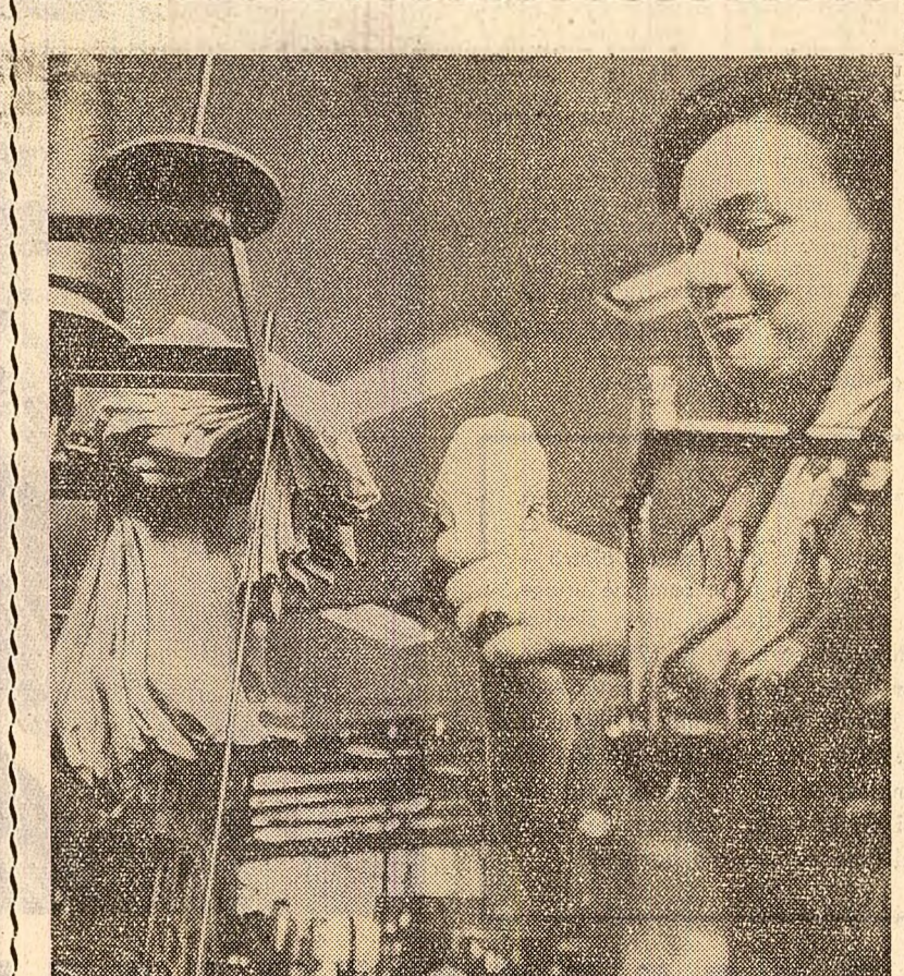
Fabrica de ciorapi din Timisoara, una din cele mai vechi și mai mari unități industriale de acest gen din țara noastră, cunoaște un proces continuu de dezvoltare a capacităților de producție și de înnoire a proceselor tehnologice și a sortimentelor. Printre ultimele realizări se numără amenajarea unei secții de producție la Sinciclov Mare, cu o capacitate anuală de 2 milioane perechi ciorapi, adaptarea mașinilor de tricoot "Ideal" de tip clasic - gratie unor inovări tehnice - pentru producerea de ciorapi buclati, (articol foarte solicitat la export), introducerea în fabricație a unei colecții de 32 modele noi de ciorapi și șosete etc. Dar ceea ce are ca solicitat în mod deosebit eforturile întregului colectiv de specialiști și muncitorii din fabrică o constituie introducerea în procesul tehnologic a fibrelor chimice românești. În anul 1970, de pilda, au fost realizați 5,7 milioane de perechi de ciorapi și șosete din fibre poliamicide supraelastiche și din fibre poliesterice. Noua tehnologie de fabricație a impus și utilizarea unor procedee moderne de finisaj, fapt care a determinat o creștere sensibilă a valorii produselor. Cele mai multe hirtii fabricate la Timisoara sint tot mai mult solicitate nu numai pe piața internă, ci și la export. Anul acesta, în fabrică vor fi finalizate studiile privind extinderea utilizării politerilor și a firelor P.N.A., ceea ce va crea posibilități noi pentru sporirea gamei de ciorapi de calitate superioară.

ȘI LAGYI Domokos tehnician Fabrica de sticlă Poiana Codrului