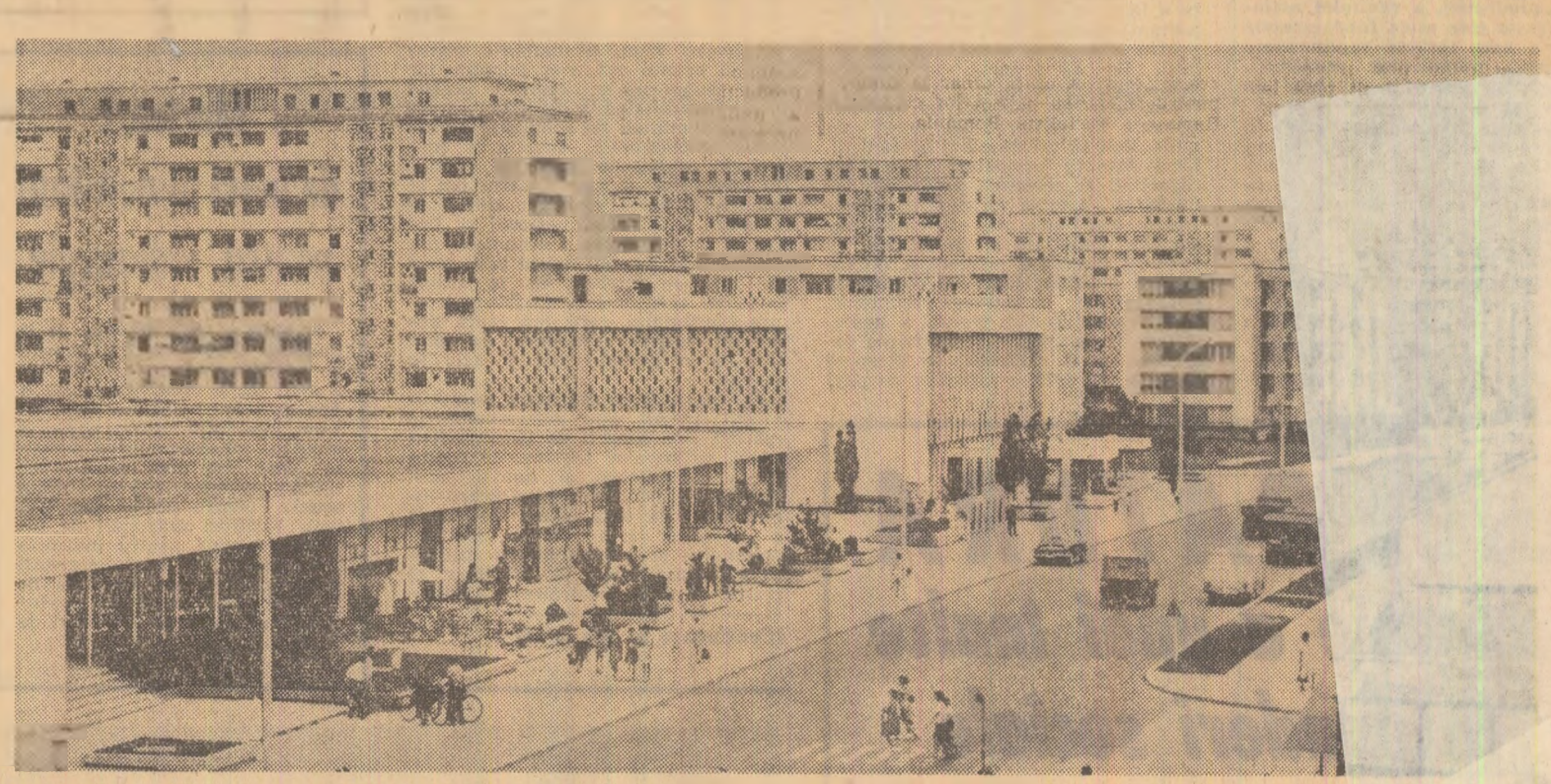
Metamorfoze arhitectonice în citadela aurului negru — imagine din cartierul Ploiești-Nord

BRAȘOV (corespondentul "Scintei", N. Măcaru). În zona de est a Brașovului, care cunoaște o puternică dezvoltare, a început construcția unui spital-policlinic, cu o capacitate de 686 de paturi. Corpul principal, cu parter plus 6 nivele, va adăposti spitalul propriu-zis cuprinzînd secții de chirurgie, de interne, de pediatrie, de obstetrică și ginecologie. El va dispune de o stație de oxigen, de instalație de reconducere a aerului și altele amenajări necesare funcționării unui spital modern. Noul spital ur-