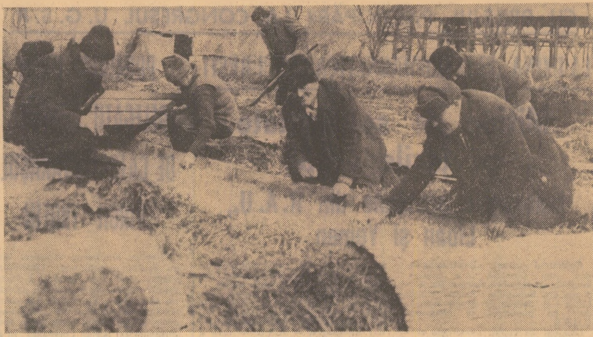
Cooperativa agricolă din Tămădău, județul Ilfov, cultivă și o suprafață însemnată cu legume. Pentru obținerea unei recolte mari și cit mai timpurii, cooperativii se îngrijesc să asigure răsăduri de bună calitate

Asigurăm conducerea partidului, pe dumnea voastră, iubite tovarășe Nicolae Ceaușescu, că toți oamenii muncii din municipiul nostru, umăr cu umăr, vor strînge și mai mult rîndurile în jurul Comitetului Central, consacrandu-ne întreaga noastră energie și capacitate de muncă pentru înaltarea României pe care o avem mai multe trepte ale civilizației socialiste.