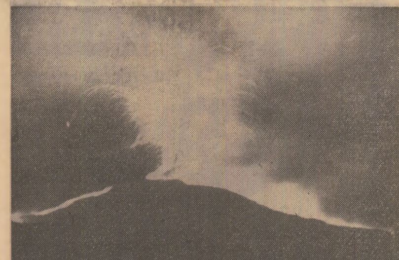
Vulcanul Etna din nou erupe, stîrnînd îngrijorare în rîndul sicilianilor din împrejurimi