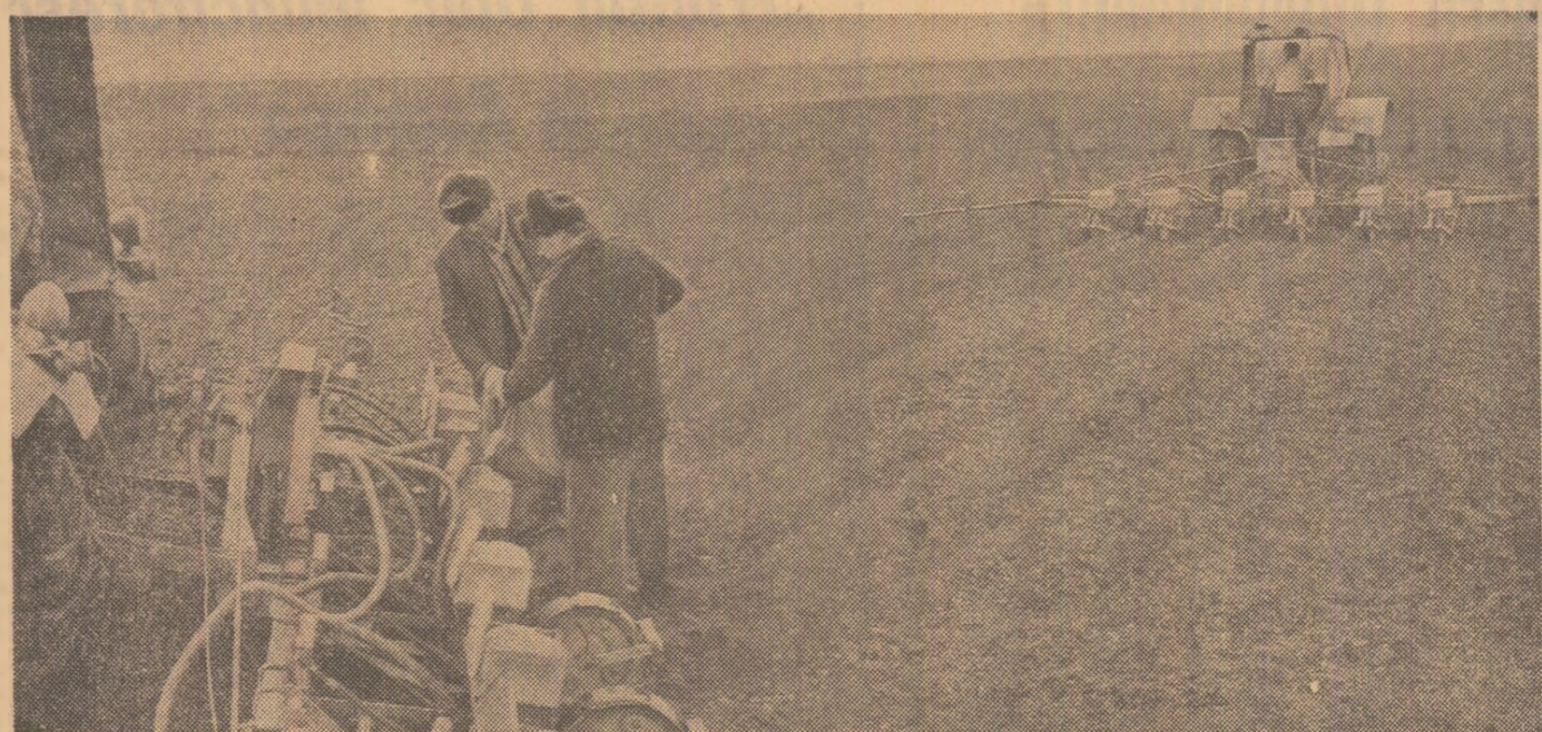
Îndată ce pămîntul s-a zvințat, iar temperatura a atins nivelul optim, cooperatorii din Gruia, județul Ilfov, cu ajutorul mecanizatorilor, au trecut cu toate forțele la semănatul porumbului.

Folosirea judicioasă a capacităților de producție, mobilizarea și punerea în valoare a resurselor interne existente la fiecare loc de muncă — au constituit obiectivul principal urmărit în activitatea organelor și organizațiilor de partid și a colectivelor de muncă din întreprinderi. Ca urmare, planul productivității muncii pe trimestrul I a fost îndeplinit și depășit, obținîndu-se peste nivelul prevăzut o productivitate de 412 lei pe fiecare salariat, față de angajamentul de 350 lei pe un salariat cit era stabilit în perioada amintită.