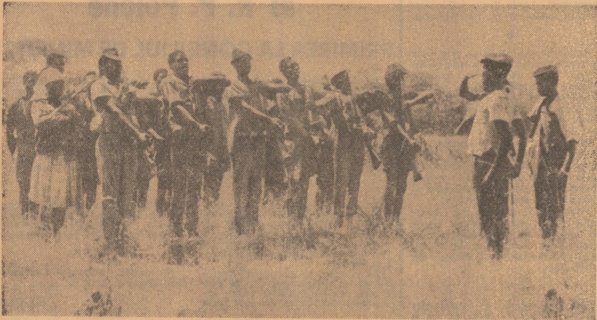
In fotografie: O unitate a forțelor armate de eliberare din Angola în timpul unui antrenament pentru pregătirea de luptă împotriva colonialiștilor portughezi