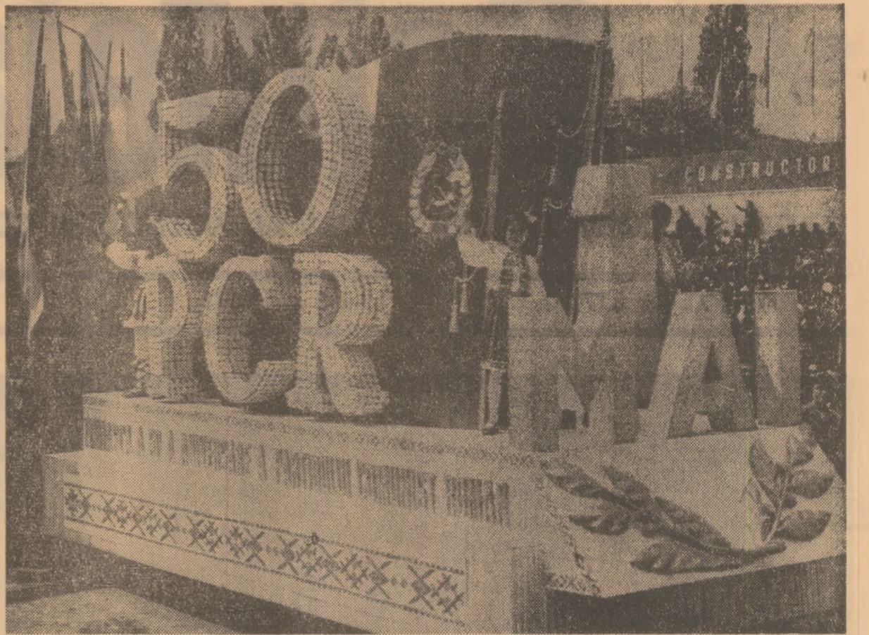
O cifră vie, prezentă în aceste zile în toate inimile: 50. Ea a dominat, pretutindeni în țară, manifestația de 1 Mai