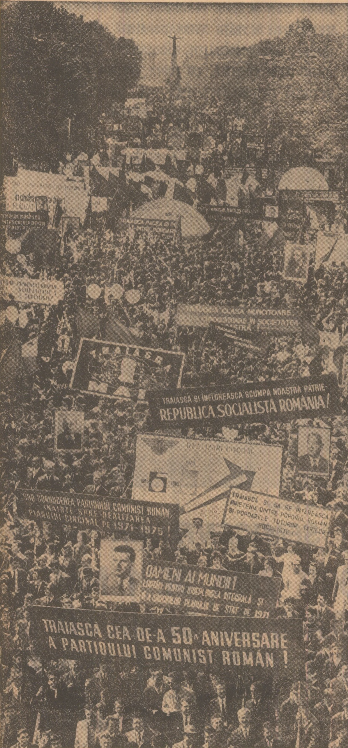
O nesfârșită revărsare de oameni, o revărsare de entuziasm, de culori, de pancarte, portrete, grafice, flori. Și din toate acestea, un singur gând, un singur glas: slavă Partidului Comunist Român la semicentenarul său, luptei sale pentru fericirea națiunii noastre socialiste, salut frățesc de caldă solidaritate oamenilor muncii din lumea întreagă!