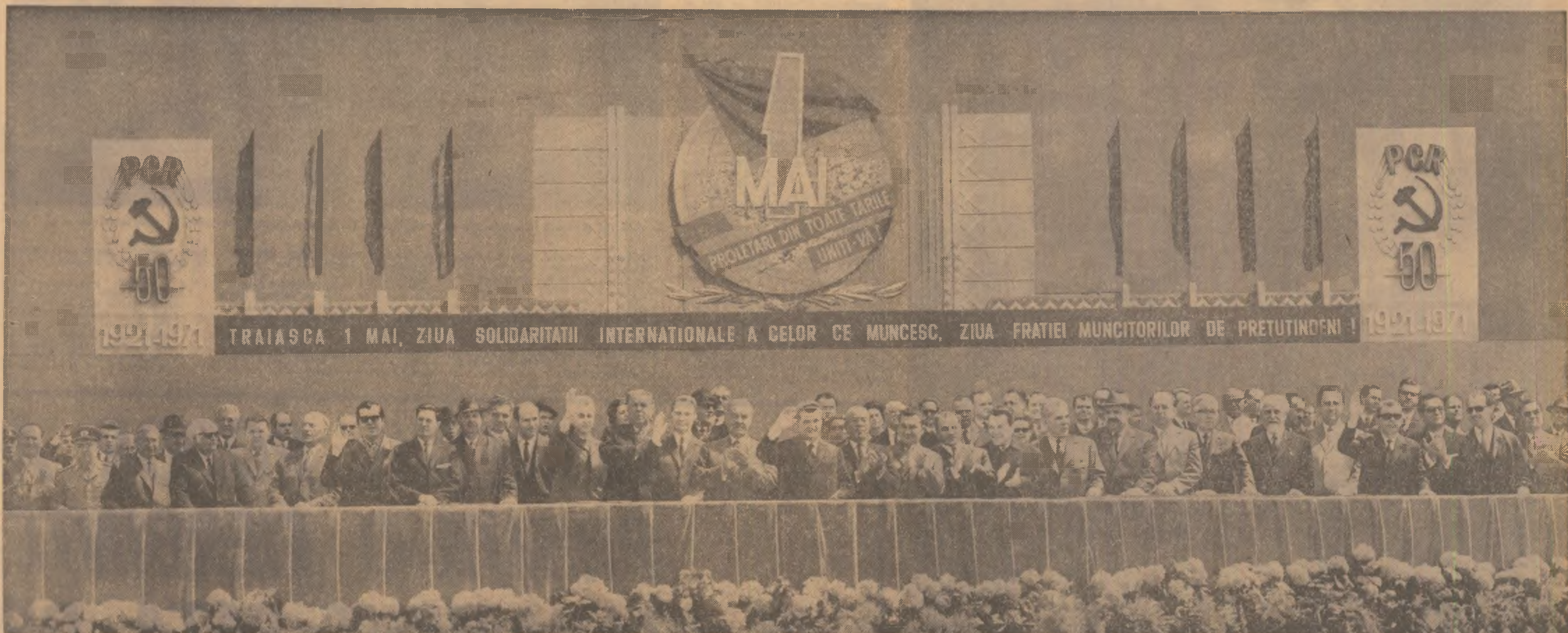
Tribuna centrală în timpul demonstrației oamenilor muncii din Capitală

CU PRILEJUL ZILEI DE 1 MAI, OAMENII MUNCII DIN ROMÂNIA, STRÎNS UNIȚI ÎN JURUL PARTIDULUI, ȘI-AU EXPRIMAT VIBRANT SENTIMENTELE DE FRĂȚIE INTERNAȚIONALISTĂ FAȚĂ DE POPOARELE TUTUROR ȚĂRILOR SOCIALISTE, SOLIDARITATEA CU CLASA MUNCITOARE INTERNAȚIONALĂ, CU LUPTA TUTUROR FORȚELOR CARE MILITEAZĂ PENTRU SOCIALISM, PACE, DEMOCRAȚIE ȘI PROGRES ÎN LUMEA ÎNTREGĂ!