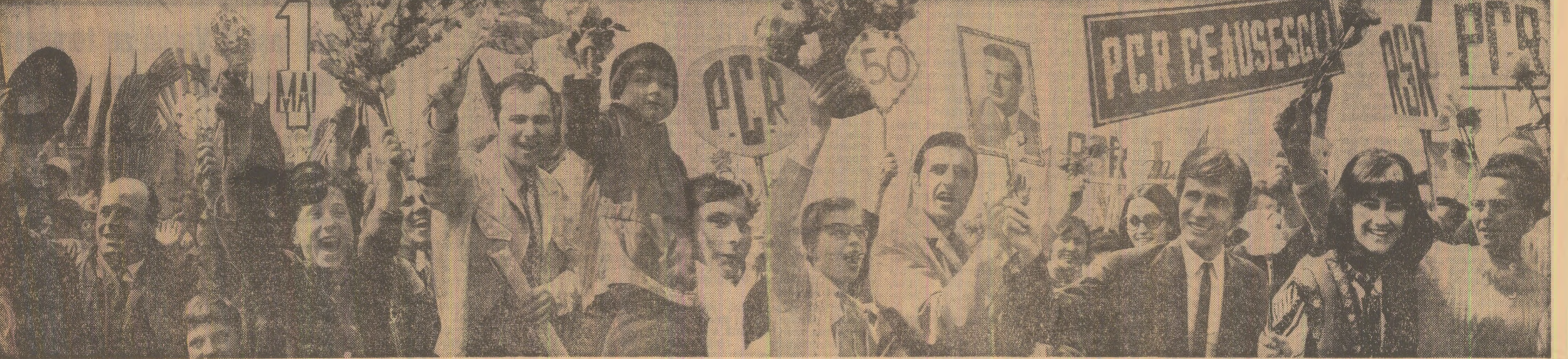
Partidului — cele mai înalte gînduri, cele mai alese simțămînte. Ca un singur om, poporul român omagiază partidul său comunist.