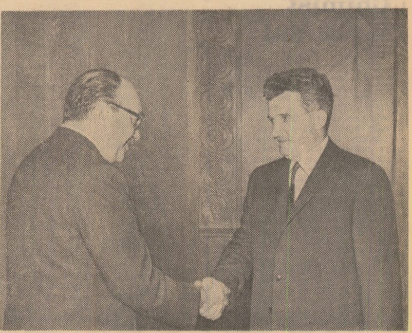
releor române și chiliane, al colaborării și păcii mondiale. S-a făcut, totodată, un schimb de opinii în legătură cu unele probleme actuale ale vieții politice internaționale. Convorbirea s-a desfășurat într-o atmosferă cordială, prietenească.

În cursul convorbirilor, care a avut loc cu acest prilej, a fost relevată evoluția pozitivă a relațiilor dintre Republica Socialistă România și Republica Chile, precum și dorința comună de a dezvolta și extinde colaborarea multilaterală dintre cele două țări, în interesul popoare-