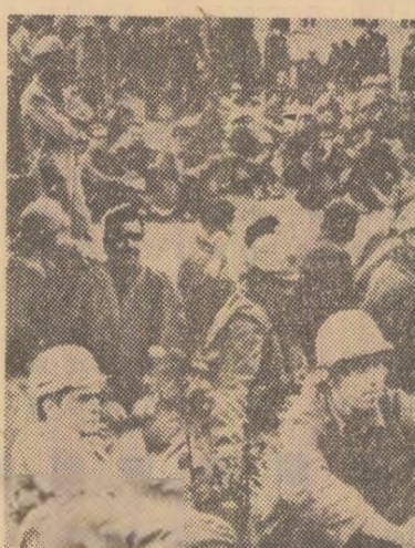
R. F. a Germaniei. Muncitorii greviști la șantierul naval Howaldt din Kiel. Ei cer îmbunătățirea condițiilor de muncă și a sistemului de salarizare