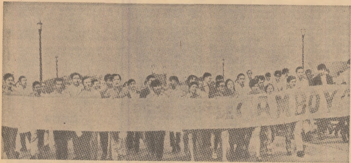
Demonstrație de protest a studenților venezueleni, la Caracas, împotriva agresiunii americane în Indochina