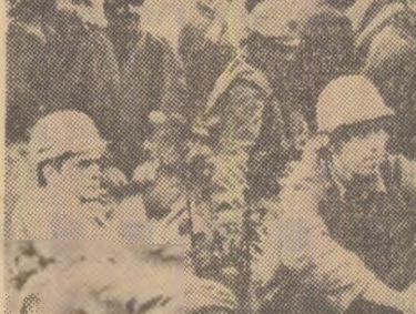
R. F. a Germaniei. Muncitorii greviști la șantierul naval Howaldt din Kiel. Ei cer îmbunătățirea condițiilor de muncă și a sistemului de salarizare

După cum este cunoscut, România a fost printre țările care au avut un rol de seamă în inițierea și constituirea Organizației Națiunilor Unite pentru Dezvoltare Industrială și a participat activ la dezvoltarea activităților sale. Țara noastră consideră că trebuie să de aci înainte să se poată realiza în mod eficient rolul determinant pe care îl joacă industrializarea în progresul economic și social al statelor și de la luarea în considerare a contribuției pe care O.N.U.D.I. ca organism internațional o poate aduce la accelerarea industrializării țărilor în curs de dezvoltare, la promovarea unei largi cooperări internaționale, în vederea facilitării dezvoltării industriale a tuturor statelor.