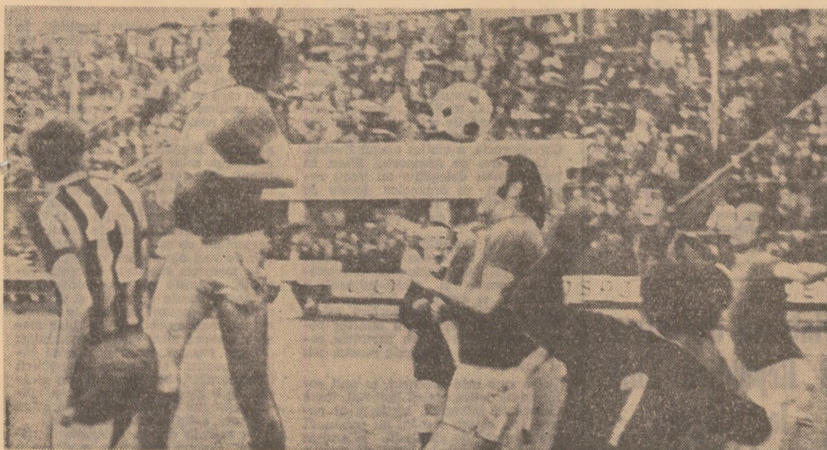
lenenii, masaji in propriul careu de o echipa (Progresul) dezlanțuită...