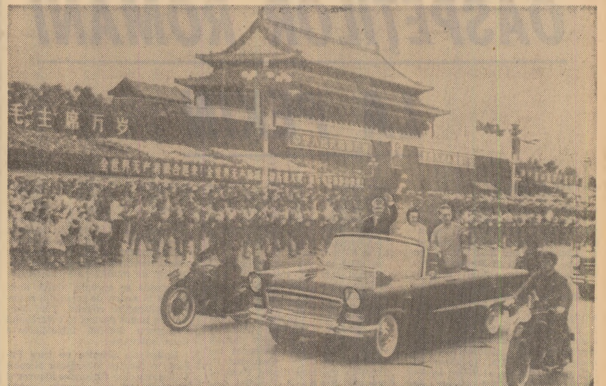
Pe străzile capitalei R. P. Chineză, tovarășul Nicolae Ceaușescu răspunde urârilor de bun venit

În sănătatea tovarășilor și prietenilor prezenți !