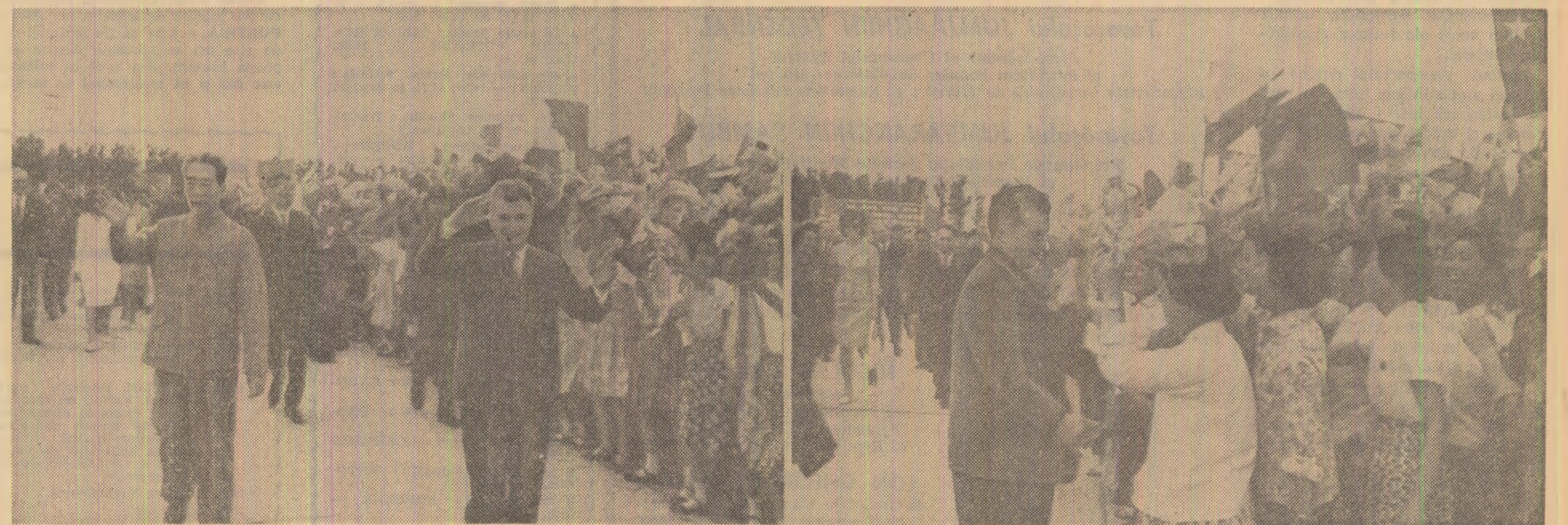
Două imagini din numeroasele momente ale primei zile a vizitei, desfășurată sub semnul prieteniei și prejiurii reciproce

În timpul recepției, care s-a desfășurat într-o atmosferă de caldă prietenie și cordialitate, au fost în-tonate imnurile de stat ale celor două țări. Tovarășii Ciu En-lai și Nicolae Ceaușescu au rostit toasturi, subliniate în repetate rînduri cu vii aplauze.