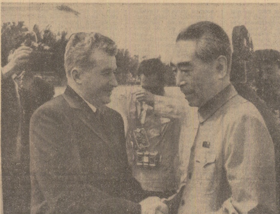
Primire călduroasă pe aeroportul din Pekin