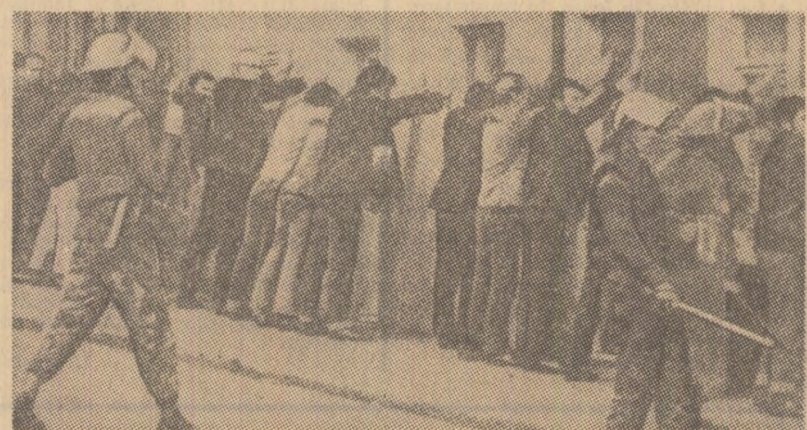
În urma recențelor tulburări care au avut loc la Belfast (Irlanda de Nord), trupele britanice, staționate în oraș, organizează razii în căutarea celor vinovați. În ultimele zile au fost arestați 30 de persoane. În fotografie: perchezaj pe o stradă a orașului