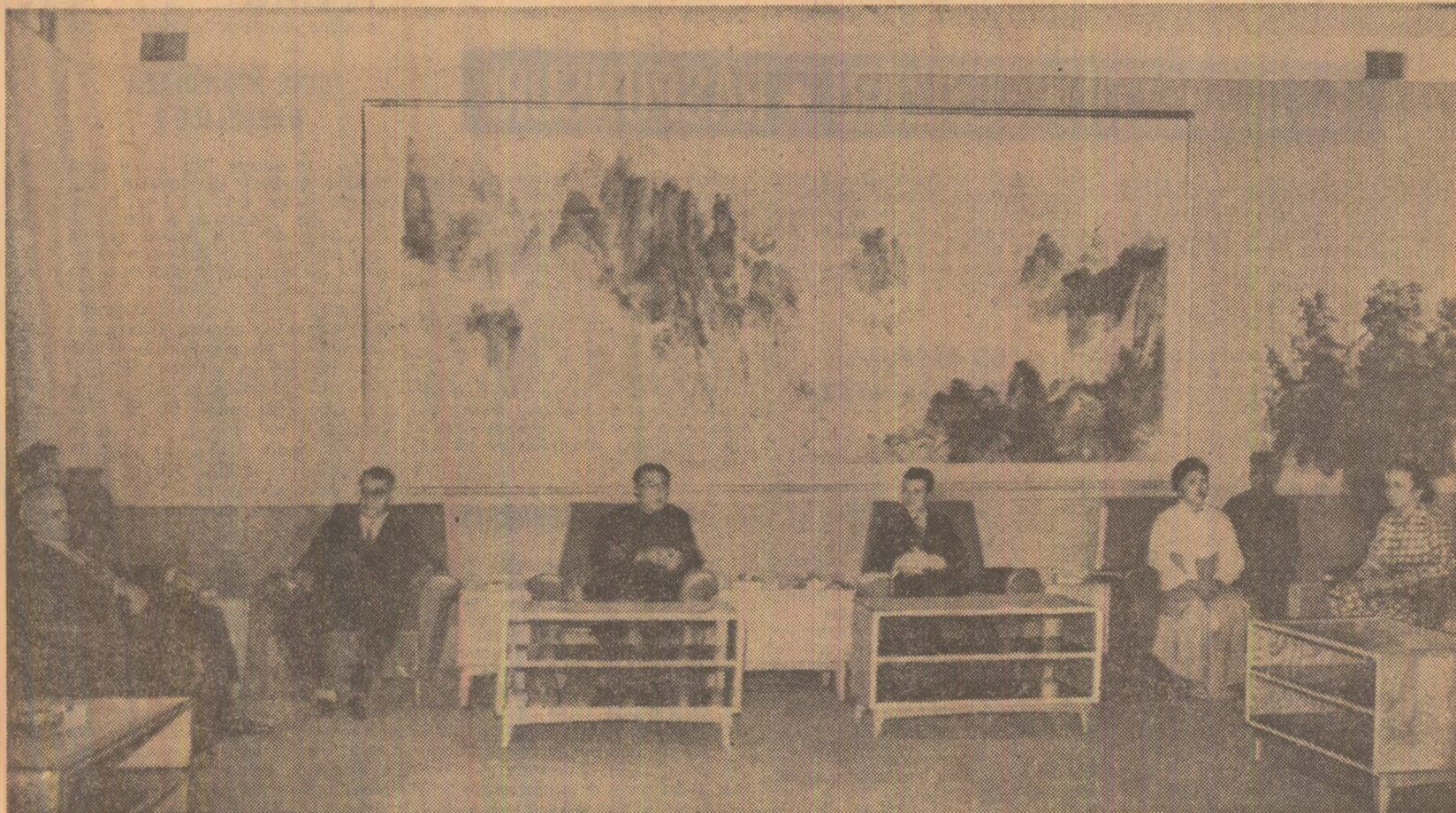
În timpul vizitei protocolare făcută de tovarășul Kim Ir Sen, tovarășului Nicolae Ceaușescu

Convorbirile s-au desfășurat într-o atmosferă de prietenie frățească.