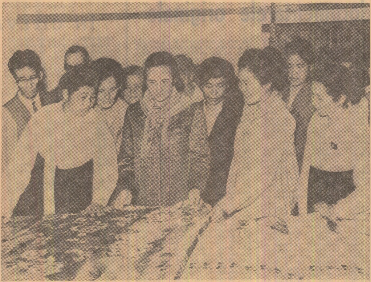
Tovarășa Elena Ceaușescu, însoțită de tovarășa Kim Sâng E, în vizită la Fabrica de țesături de mătase din Phenian

femeile din România față de copiii orfan coreeni care au găsit o adevărată familie la mil de kilometri depărtare de patria lor, în perioada de după încheierea războiului declanșat de imperialismul american în anii 1950—1953.