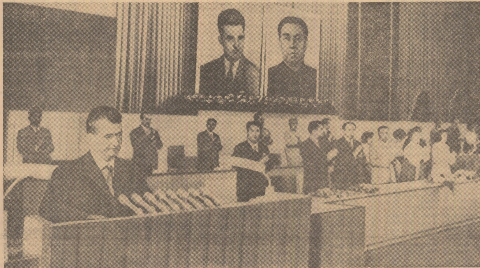
Tovarășul Nicolae Ceaușescu vorbind la miingul prieteniei coreeano-române

Recepție oferită de tovarășul Nicolae Ceaușescu și soția sa, Elena Ceaușescu