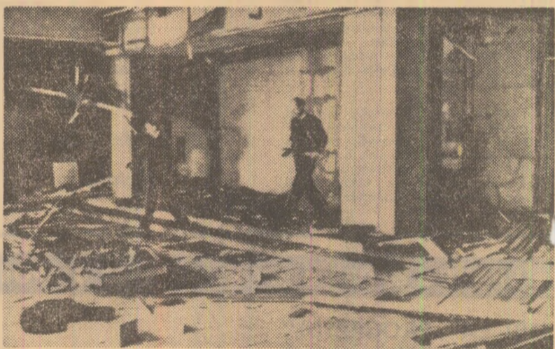
O bombă explodată luni într-o clădire din Londonderry, unde erau cazați polițiștii, a marcat sfârșitul unui week-end dominat de numeroase incidente în Irlanda de nord. În fotografie — urmăritele atentatului

„După părerea noastră, a arătat el, un adevărat acord care să prevadă deplina retrocedare a Okinawei va trebui să cuprindă următoarele clauze: anularea privilegiilor acordate S.U.A. în Okinawa; desființarea și retragerea tuturor bazelor și forțelor militare din Okinawa; suspendarea oricăror drepturi ale americanilor de a folosi spațiul, electricitatea, drumurile și mijloacele de comunicație; compensarea stricăciunilor provocate de forțele americane; dreptul autorităților japoneze de a judeca delictele penale comise de americani; transferarea către Japonia a așa-numitei proprietăți americane fără nici un fel de compensații, curmarea imediată a activității postului de radio „Vocea Americii” și a cablului submarin dintre Okinawa și Taiwan, indicarea clară a datei la care acordul va intra în vigoare”.