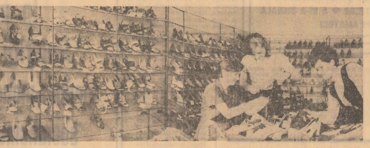
URMARE DIN PAG. 1