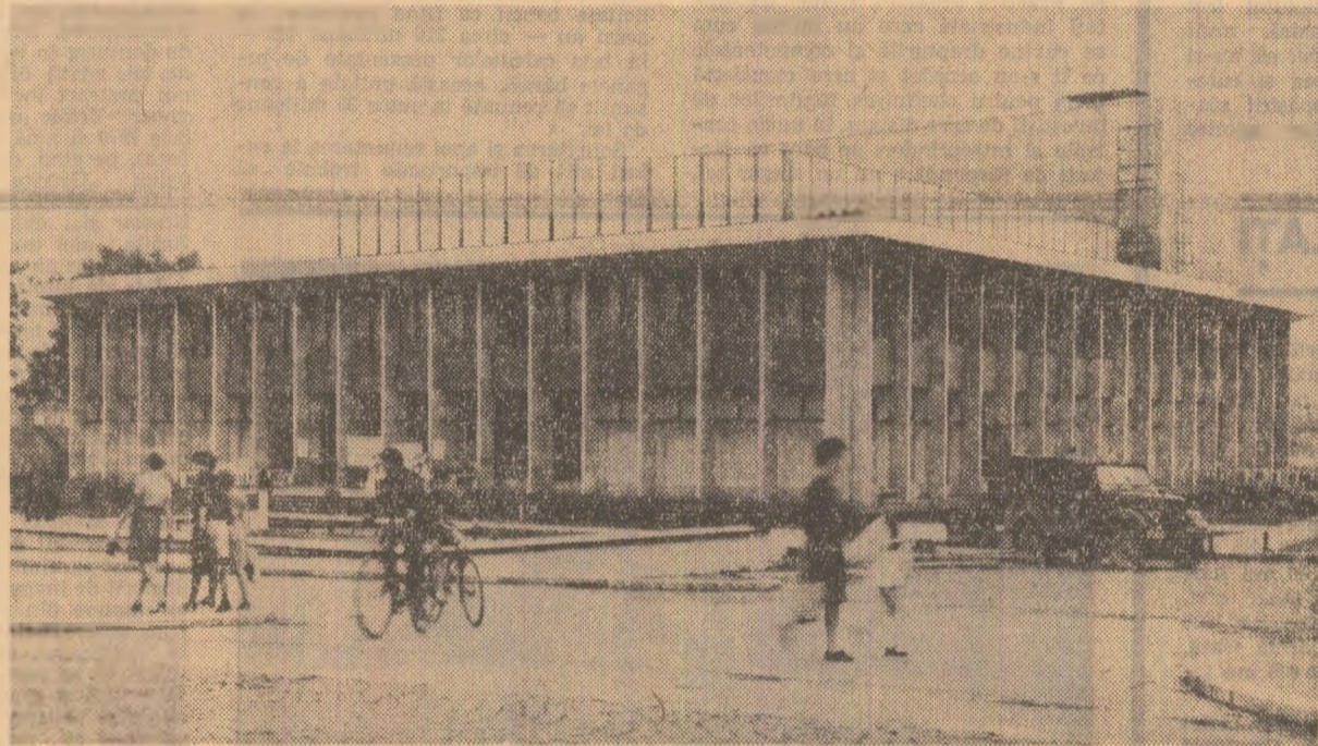
Casa de cultură din Petroșani