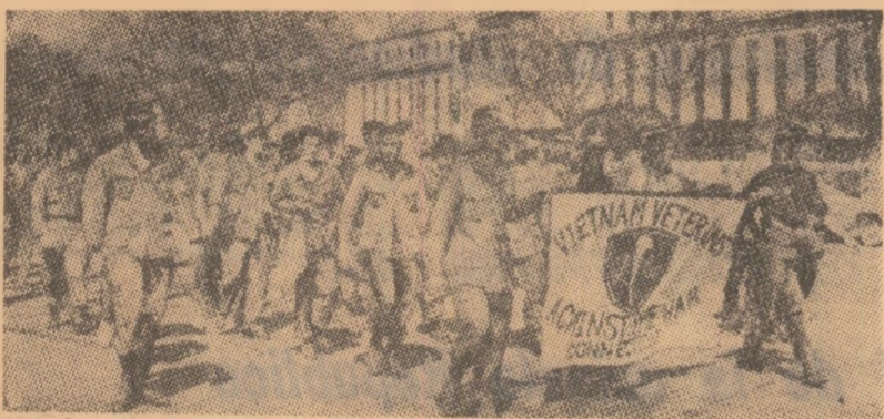
Foști luptători pe fronturile sud-vietnameze, îmbrăcați în uniformă, demonstrează la Washington pentru încetarea războiului din S.U.A. în Vietnam