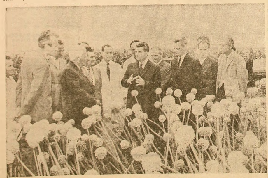
Dialog cu specialiștii Stațiunii experimentale pentru culturi irigate — Valu lui Traian

Este îmbucurător că această convingere, care a fost și pînă acum susținută în cercuri largi ale opiniei publice din România, ca și opinia publică internațională, a luat cunoștință cu viu interes de știrea întîlnirii care a avut loc recent la Pekin, între premierul Consiliului de Stat al R.P. Chineze, Ciu En-lai, și consilierul președintelui Nixon pentru problemele securității naționale, Henry Kissinger, în cursul căreia — ca urmare a dorinței exprimate de partea americană — s-a stabilit ca președintele S.U.A. să viziteze China o dată convenabil, înainte de luna mai 1972. Așa cum se arată în comunicatul adoptat, scopul întîlnirii chino-americane la nivel înalt va fi căutarea normalizării relațiilor bilaterale, precum și un schimb de vederi asupra problemelor care interesează cele două țări.