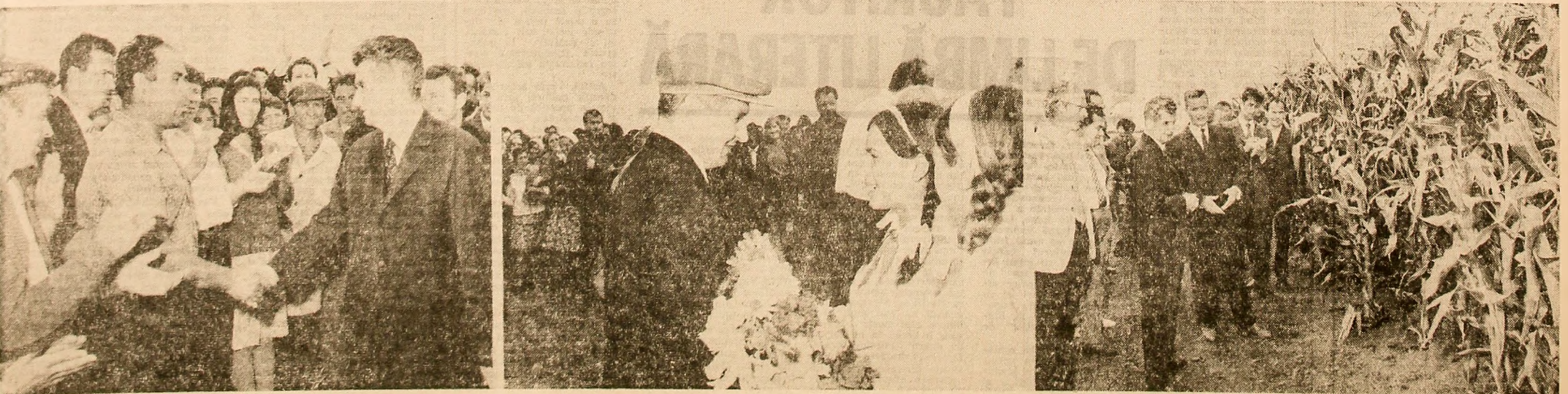
Primire caldă și entuziastă, la cooperativa agricolă de producție din Tătaru (fotografia din stînga) și la întreprinderea agricolă de stat Darabani (fotografia din mijloc); popos în lanurile de porumb ale Stațiunii experimentale pentru culturi irigate Valu lui Traian (fotografia din dreapta)

Dobrogea, cea mai aridă zonă a țării, a dus de cînd se știe lipsă de cartofi. Ea unii oameni de știință considerau că această cultură în stepa dobrogeană reprezintă o încercare lipsită de sens. Cercetătorii stațiunii Valu lui Traian au răsturnat însă fundamental această concepție, demonstrînd ce rezultate se pot obține dacă cercetarea este strîns legată de viața, de necesitățile economiei naționale. Soiul Dobrogei s-a dovedit apt nu numai să producă, dar să și ameliorizeze cartofii. Scofîndu-se la întimplare cîteva culturi au apărut tuberculi deosebit de bine dezvoltați. Semințele aduse din Brașov, zona recunoscută ca mare producătoare, au născut în solul Dobrogei sinteze cu totul originale. Mai