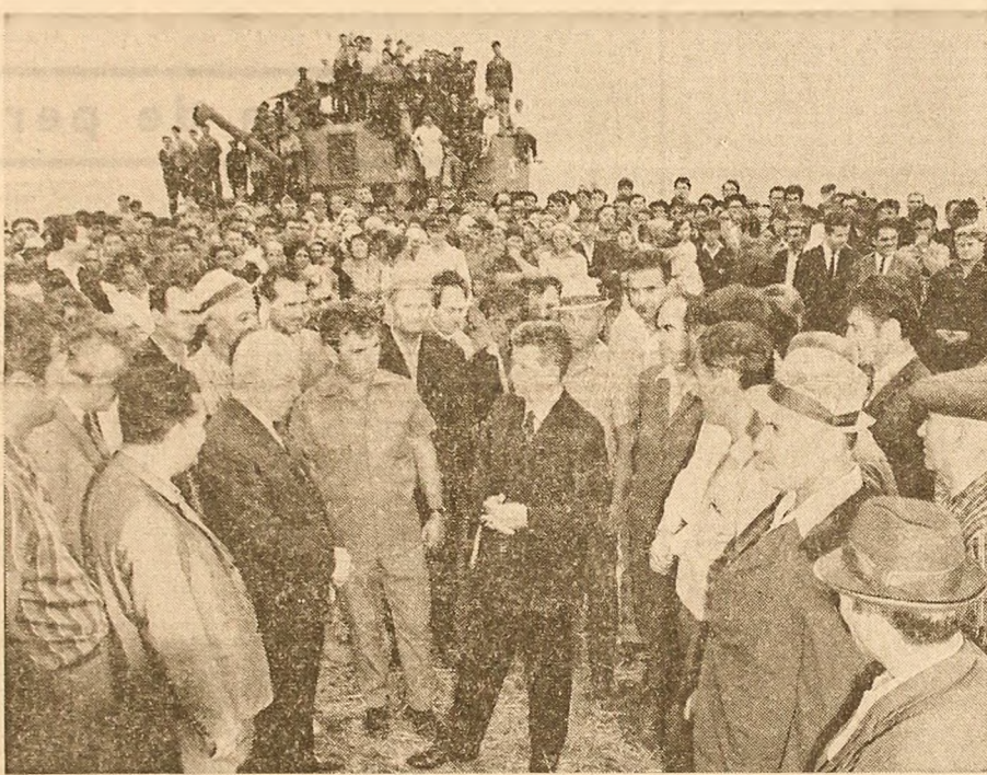
În mijlocul lucrătorilor de la marele complex intercooperatist de la Castelu

Elicopterul în care se află secretarul general al partidului, ceilalți conducători de partid și de stat, care îl însoțesc în această vizită, survolează teritoriul județului. Mirificarea priveliște a litoralului se estompează pe încetul și privirea este atrasă de peisajul rural dobrogean. Canalele de irigație ce se succed și se bifurcă în unduiri elegante, livezi și podgorii tinere se intercalază întinșelor lanuri de griu, porumb, floarea-soarelui. Se văd construcții zootehnice moderne,