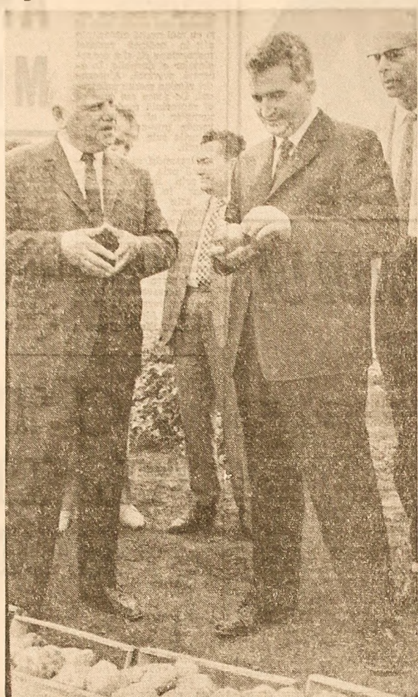
Secretarul general al partidului apreciază rezultatele obținute de cercetători în cultura cartofului pe pământul Dobrogei

La încheierea. Cum se desfășoară activitatea? răspunsul este unic, experimentul acesta confirmă: — Se desfășoară bine. Ne străduim să obținem recolte bogate și reușim. Sînt și unele greutăți, arată el, dar le rezolvăm cu forțe proprii. Luându-și rămas bun de la oamenii muncii aflați la lucru, secretarul general al partidului îi felicită pentru rezultatele bune obținute, le urăște să aibă succes în producție și activitatea lor, în viața personală.