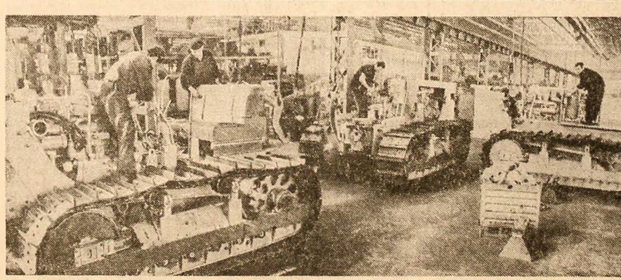
Uzinele „Tractorul” din Brașov: aspect din hala de montaj a noului tip de tractor greu pe șenile S 1 500