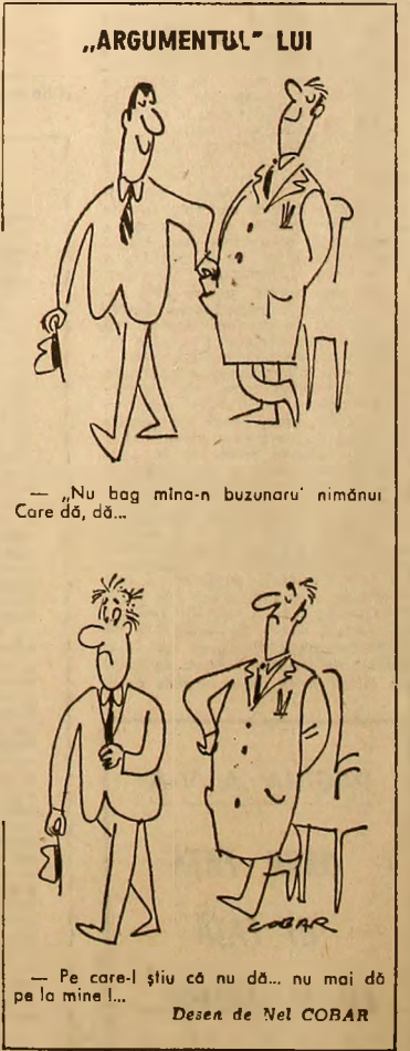
„Nu bag mîna-n buzunarul nimănui Care dă, dă...” — Pe care-l știu că nu dă... nu mai dă pe la mine!...