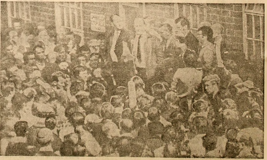
Muncitorii care au ocupat șantierul naval „Upper Clyde Shipbuilding” (Scoția) în timpul unui mîling

HAGA 3 (Agerpres). — Lucretorii portului olandez Amsterdam au constituit un comitet de solidaritate cu lupta revendicativă a muncitorilor portuari din Glasgow, care se află în grevă.